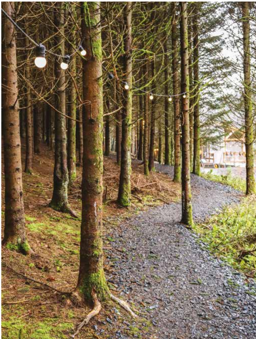
Nutchel forest village Les Ardennes, p. 150