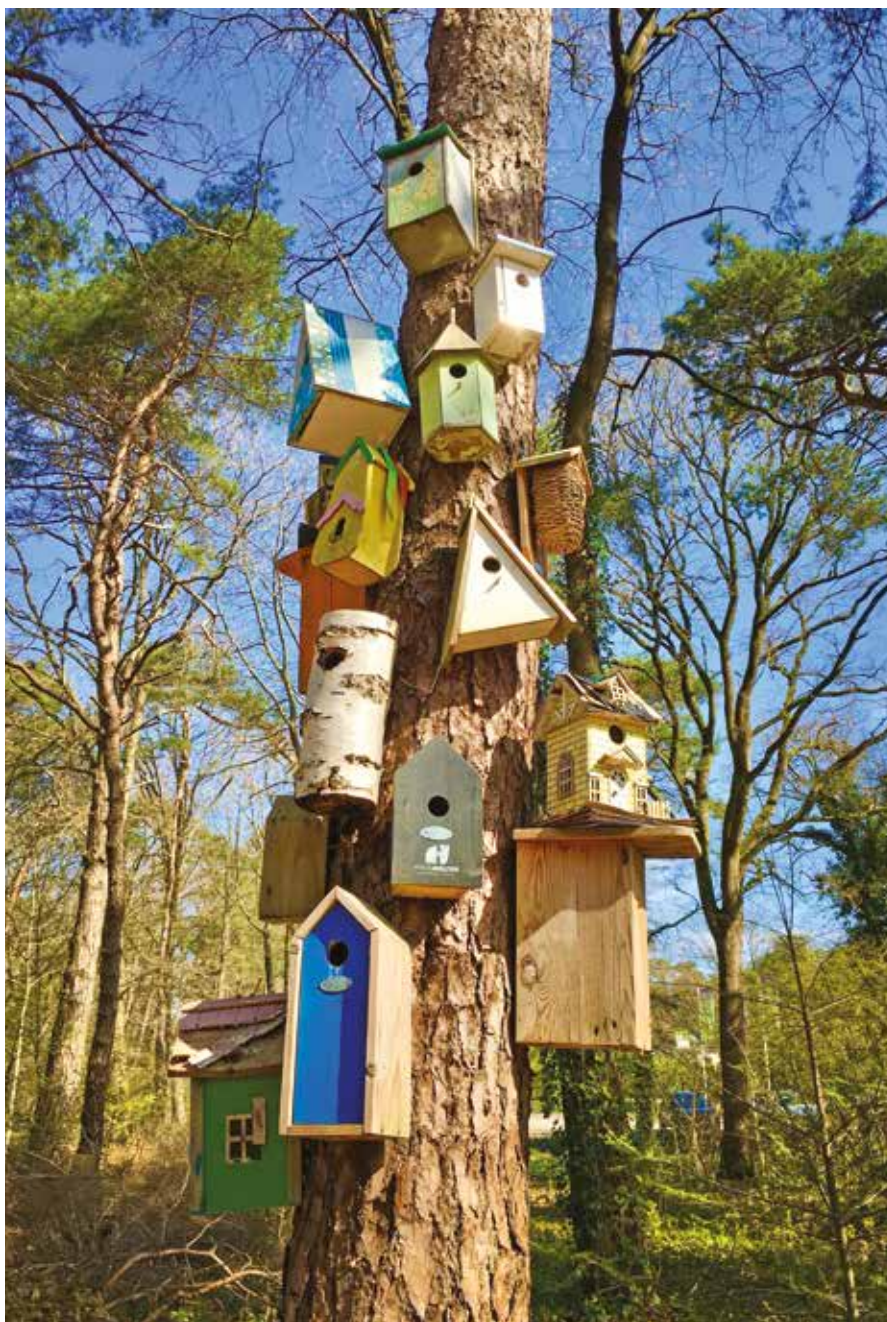
De verzameling vogelhuisjes van Restaurant & Hotel Hoog Holten, p. 23