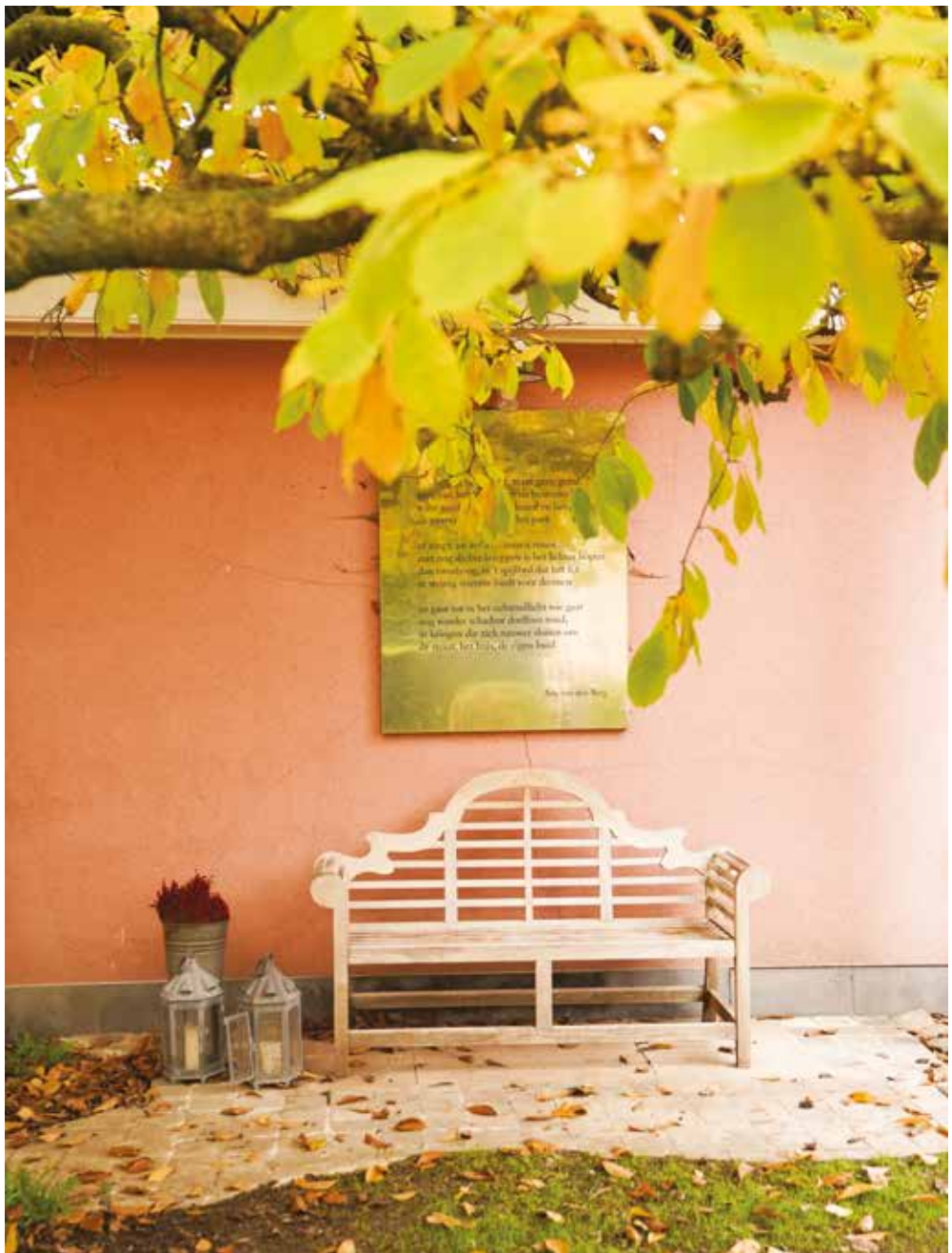
Hotel Recour, p. 168