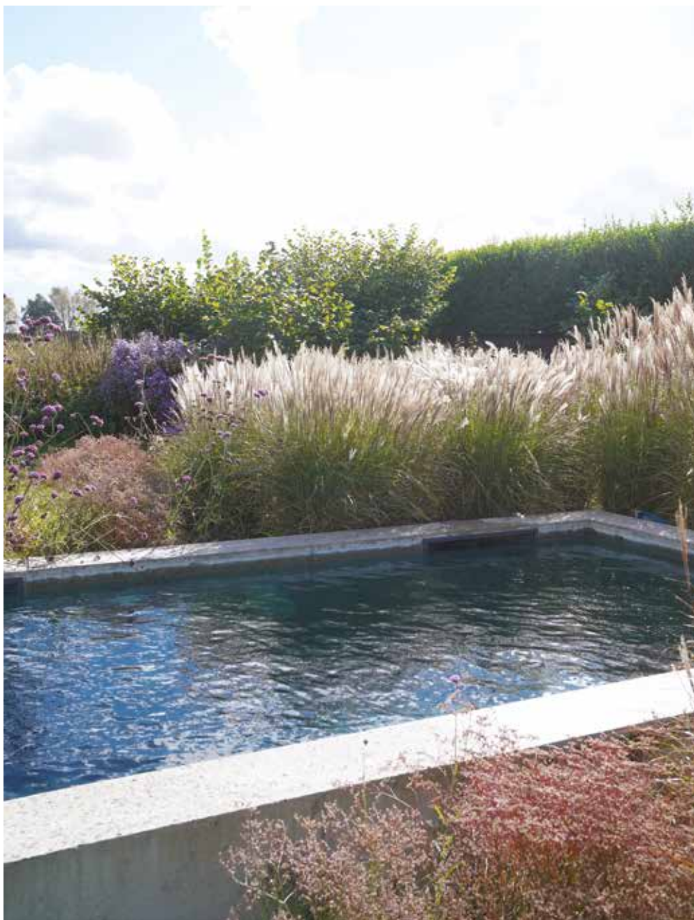
Suites 95, p. 165