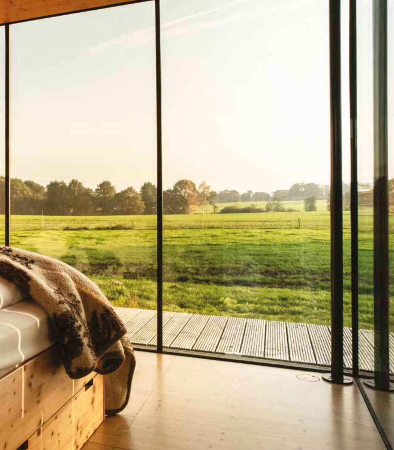
Het uitzicht vanuit de Landschapkamer, p. 20