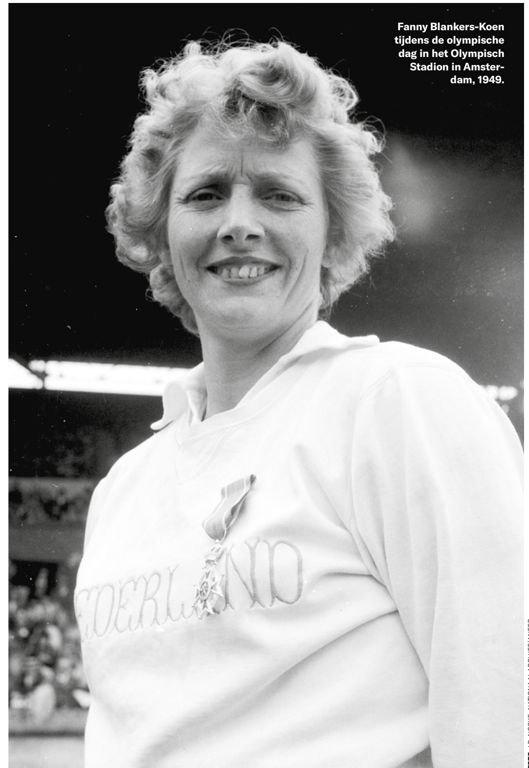
Fanny Blankers-Koen tijdens de olympische dag in het Olympisch Stadion in Amsterdam, 1949.

trouwden nog ontslagen door hun werkgever. “Nu gaat Fanny weer koken,” kopte een krant dan ook daags na haar glorieuze intocht in Amsterdam. Het destijds fameuze Life magazine stuurde een beroemde fotograaf naar Amsterdam om Fanny in huiselijke omgeving