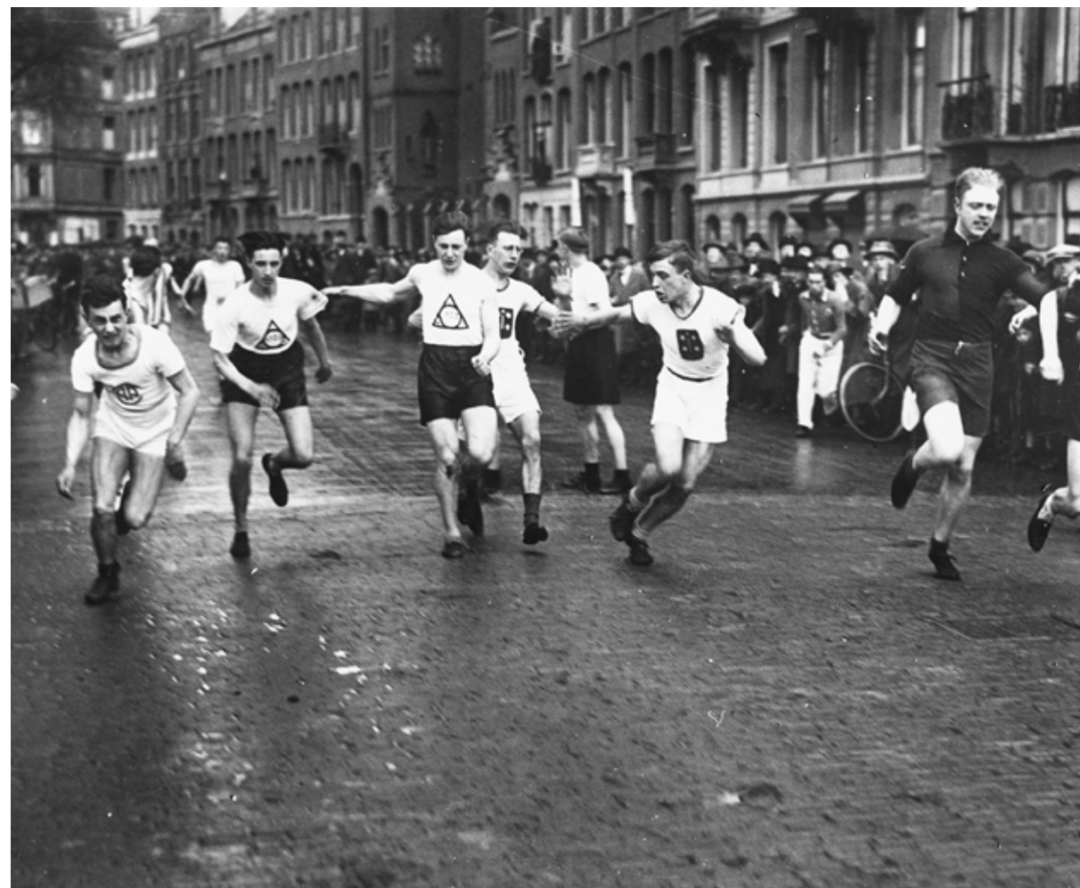
Estafettewedstrijd in Den Haag, jaren twintig vorige eeuw.

Het echte nulpunt, het moment waarop de sport hier te lande echt iets ging betekenen, is niet zo eenvoudig te bepalen. Wat dat betreft kun je ja-loers zijn op de oude Grieken, die hielden al vanaf 776 voor Christus hun beroemde sportwedstrijden. De Romeinen gingen later ook naar die heidense Olympische Spelen, totdat een chris-