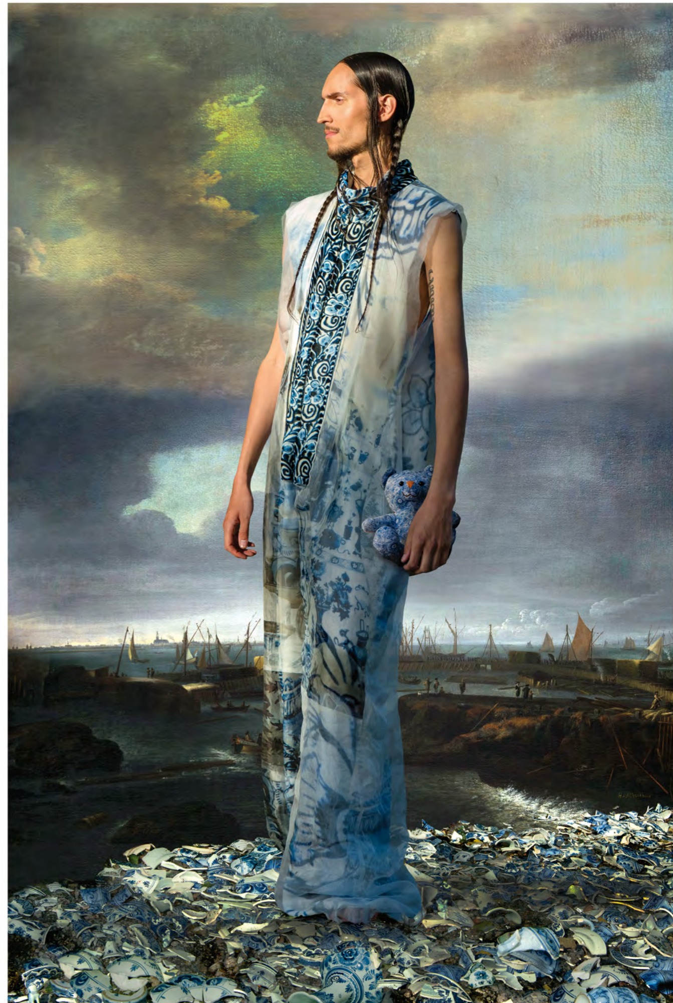
25 Strijden voor identiteit / Fight for Identity, 2020