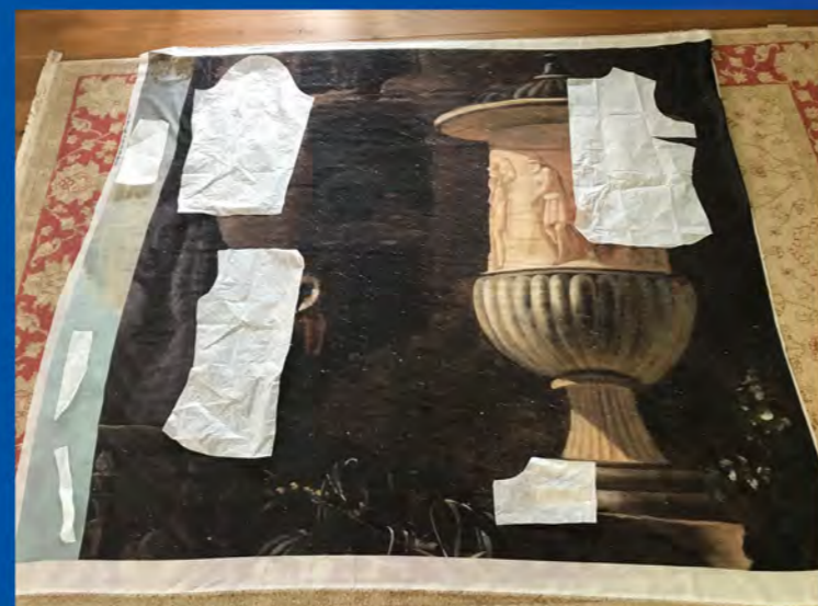
Het is passen en meten om de details op de juiste plek in het kledingstuk te krijgen.