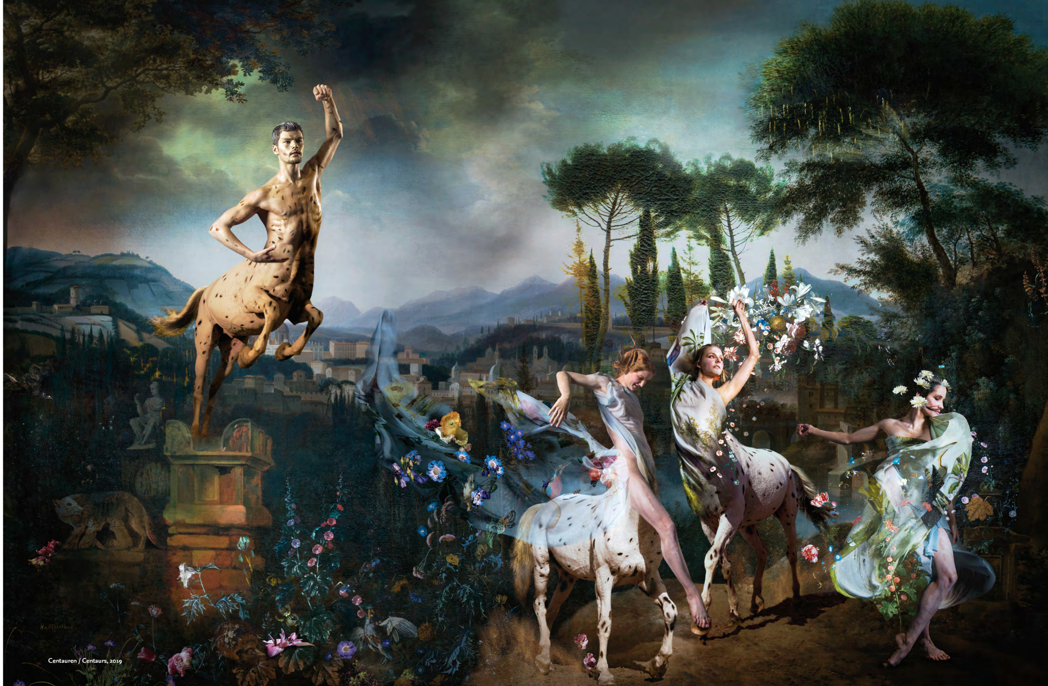
Centauri / Centaurs, 2019