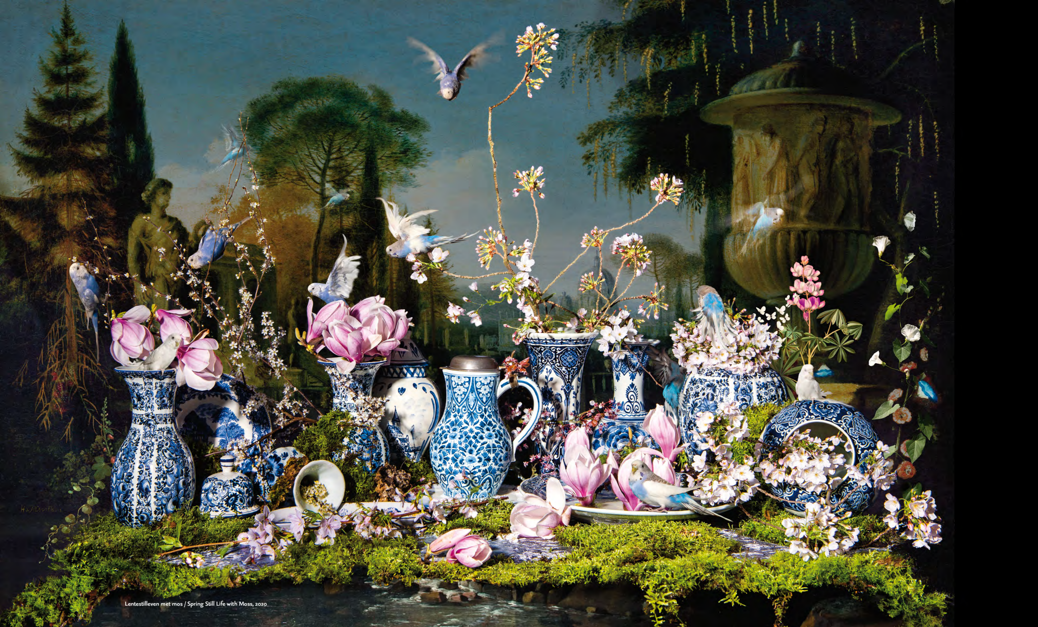
Lentestilven met mos / Spring Still Life with Moss, 2020