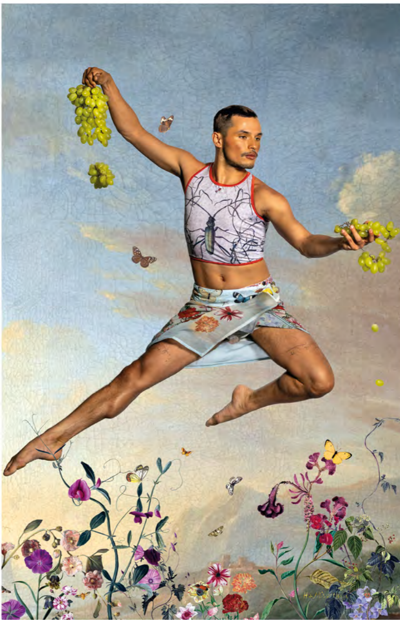
Hersft / Autumn