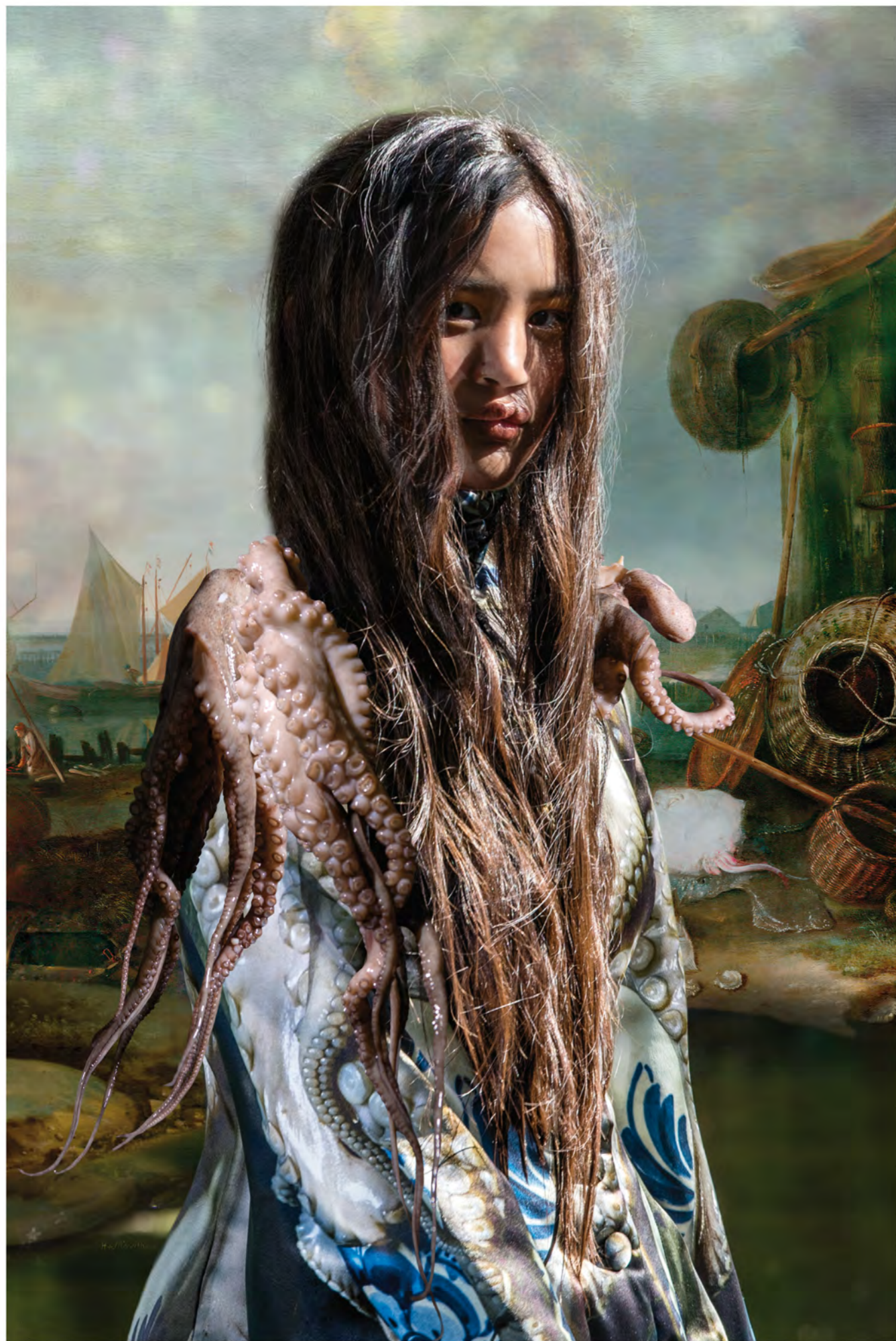
24 Strijden voor vrijheid / Fight for Freedom, 2019