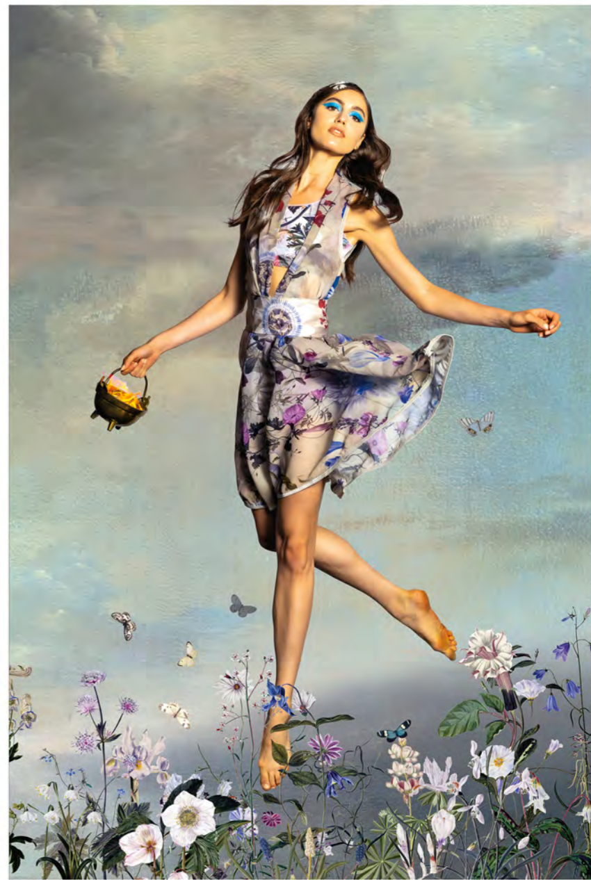
Winter / Winter