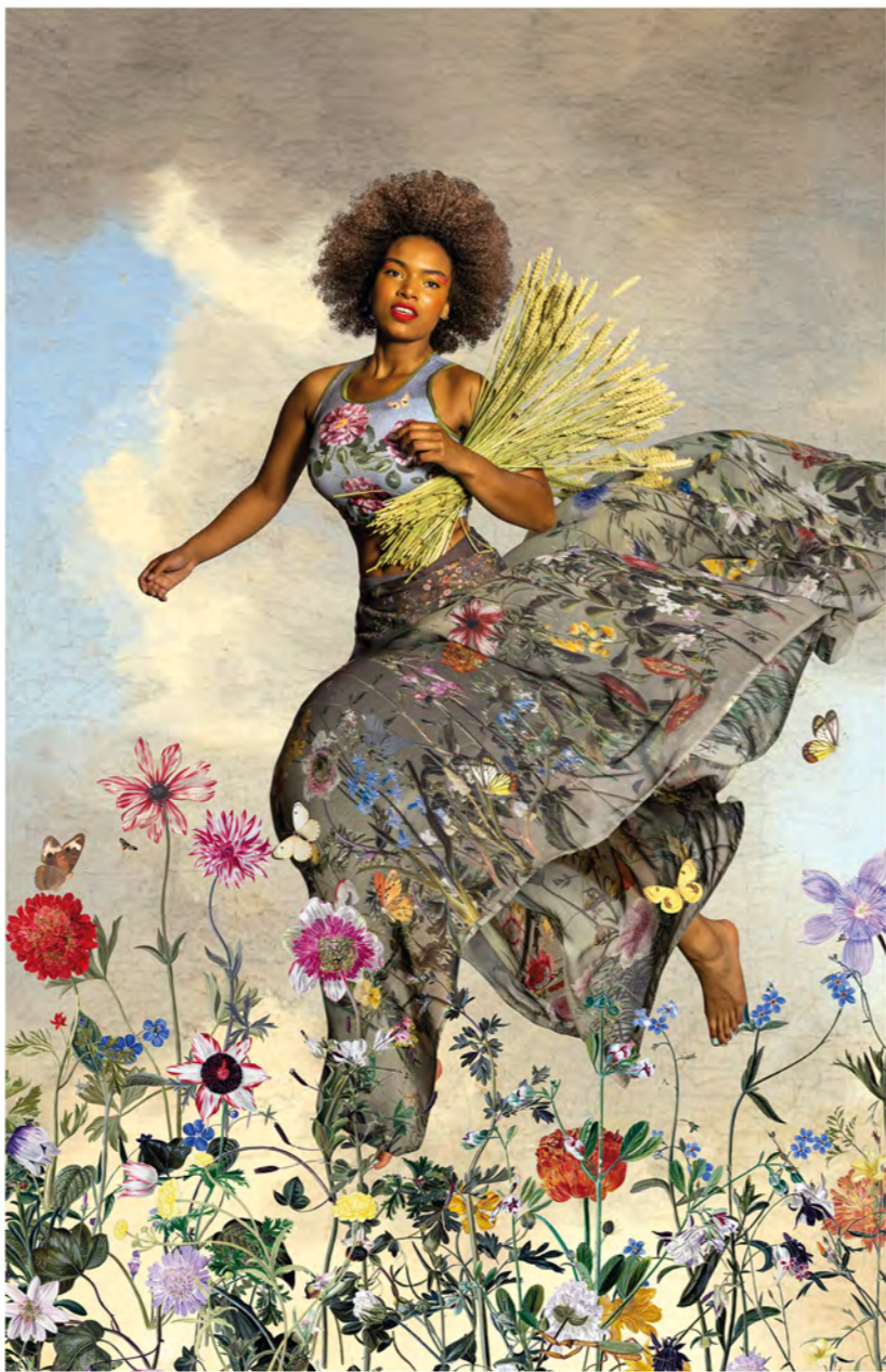
Zomer / Summer