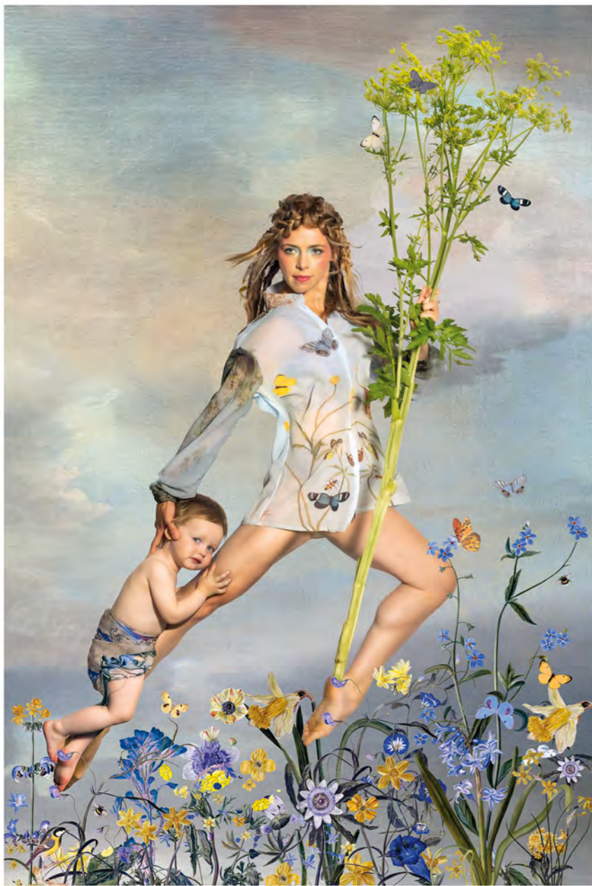
Lente / Spring