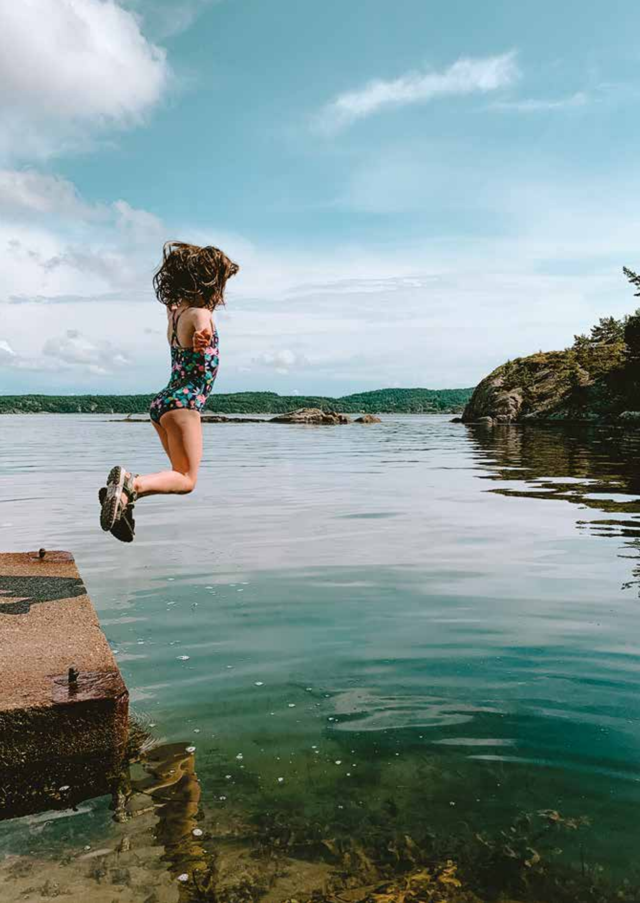
◀ Zwemmen aan het strandje bij ons huisje in Flatön