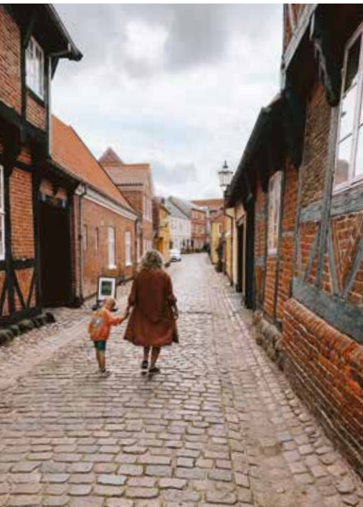
← Straatjes van Ribe