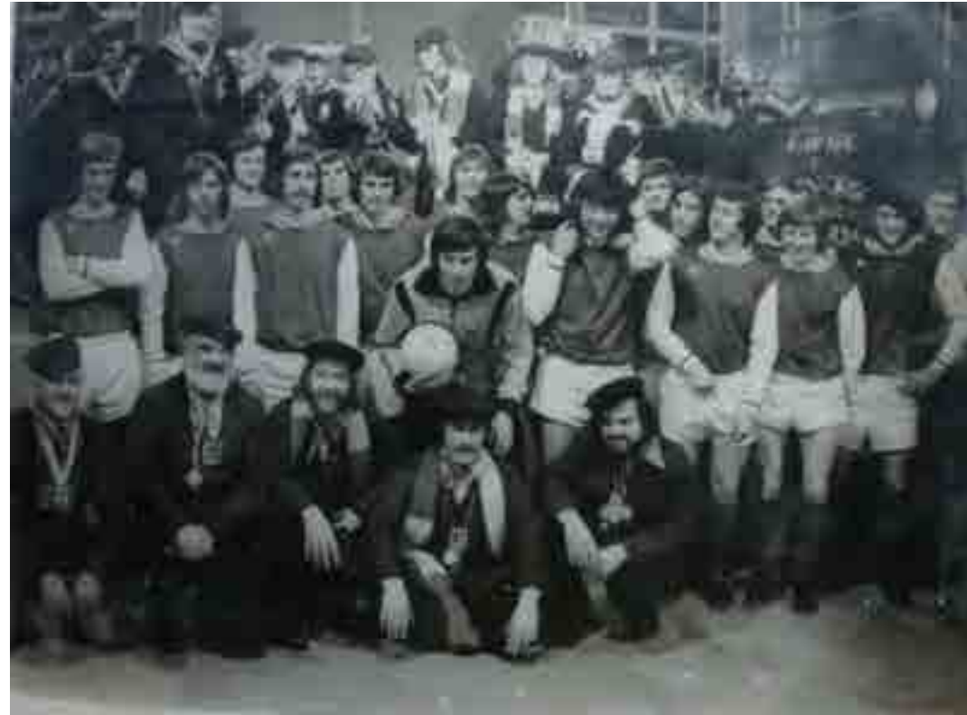
FC Den Bosch met De Deurzakkers

Tijdens het tv-optreden droegen de spelers van FC Den Bosch hun complete voetbaltenuue, inclusief korte broeken en voetbalschoenen. Maar voor het eerst verschenen ze niet in hun officiële zwart met witte shirts, maar in een blauw met wit tenue.