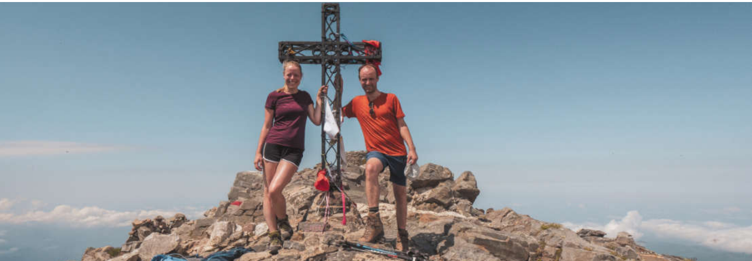
Top van de Canigó

Mensen vragen vaak waar de liefde voor Frankrijk vandaan komt. Bij mij is het een combinatie van nostalgische herinneringen aan zorgeloze vakanties die ik er als kind doorbracht, de indrukwekkende landschappen en de boeiende geschiedenis waarvan je op elke straathoek sporen vindt.