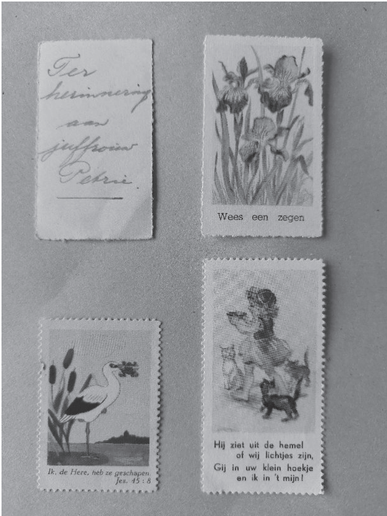
Bijbelplaatjes van de Christelijke Lagere School – 1948

Heren hand' . Ik ben blij met dat plaatje. Ik ben er zuinig op. Ook op de zondagschool krijg ik zulke plaatjes en daardoor heb ik al een hele collectie die ik in een klein sigarendoosje bewaar.