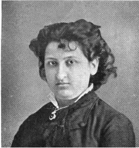
Aletta in 1878