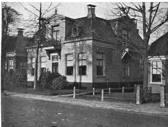
Het huis in Sappemeer waarin Aletta geboren en getogen is.

Aletta was het lievelingskind van haar vader en vanaf haar zesde jaar wilde ze in zijn voetsporen treden en dokter worden. Ze besepte toen nog niet dat dit voor een meisje niet gemakkelijk zou worden, want thuis werd geen verschil