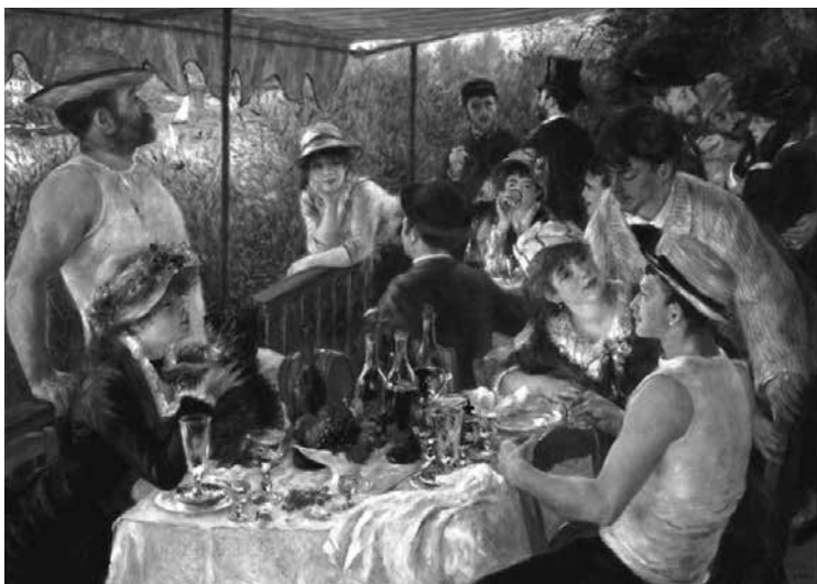
Een voorstelling van 'het goede leven'. Auguste Renoir, 'Le déjeuner des canotiers', 1880, olie op doek, 130x173 cm, Phillips Collection, Washington, VS.

haar beurt 'het regime' van de samenleving, nl. met welk soort instellingen en vertegenwoordigingen het zichzelf structuur geeft. Dat regime kan opgedrongen zijn door machtige individuen, dictators, ayatollahs of strakke ideologen zoals in totalitaire staten. Maar het kan ook het resultaat zijn van 'de algemene wil van het volk' zoals dat in democratieën tot uiting komt.