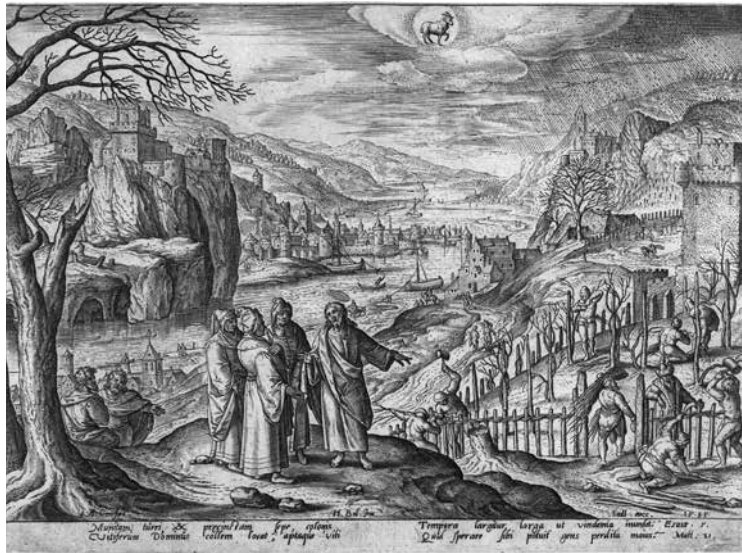
Parabel van de werkers in de wijngaard. Gravure, Adriaan Collaert, 1585, 152x208 mm, Rijksmuseum Amsterdam.

dachte, temeer omdat deze Natuurwet haar oorsprong vond in een rationeel plan. De mens, als een rationeel wezen, participeert via de Natuurwet aan deze Eeuwige Wet. Terwijl dieren, als niet-rationele schepsels, de Natuurwet slechts instinctief kunnen ondergaan heeft de mens de vrijheid om in te grijpen in de natuur. God heeft ons dus niet alleen een set van te volgen geboden gegeven. Hij heeft ons ook vrije wil en het vermogen tot rationeel denken geschonken. Door ons intellect kunnen we rationeel begrijpen wat gedaan moet worden en wat vermeden moet worden. Thomas zag in dat deze Natuurwet de 'Hogere Principes' vervat waarmee we onze handelingen rationeel kunnen beoordelen als goed of slecht. En omdat deze Hogere Principes inherent zijn aan ons menszijn, zijn ze universeel geldig voor alle mensen. Het was een baanbrekend inzicht dat er rationele, universele Principes zouden bestaan die overal gelden, ondanks culturele verschillen.