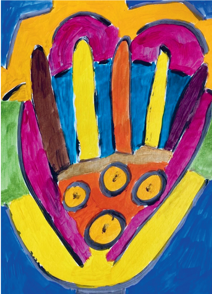
Hand - hart - hoofd