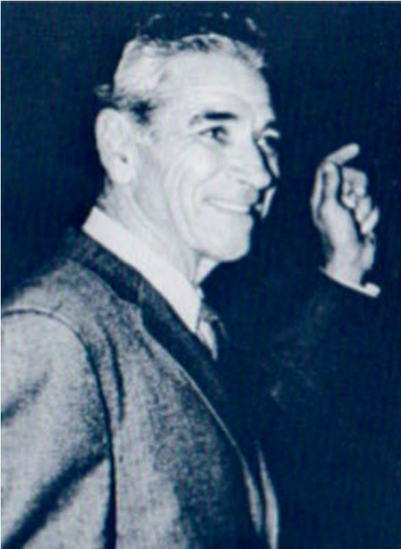
George Adamski 17 april 1891 – 26 februari 1965 Silver Spring, Maryland