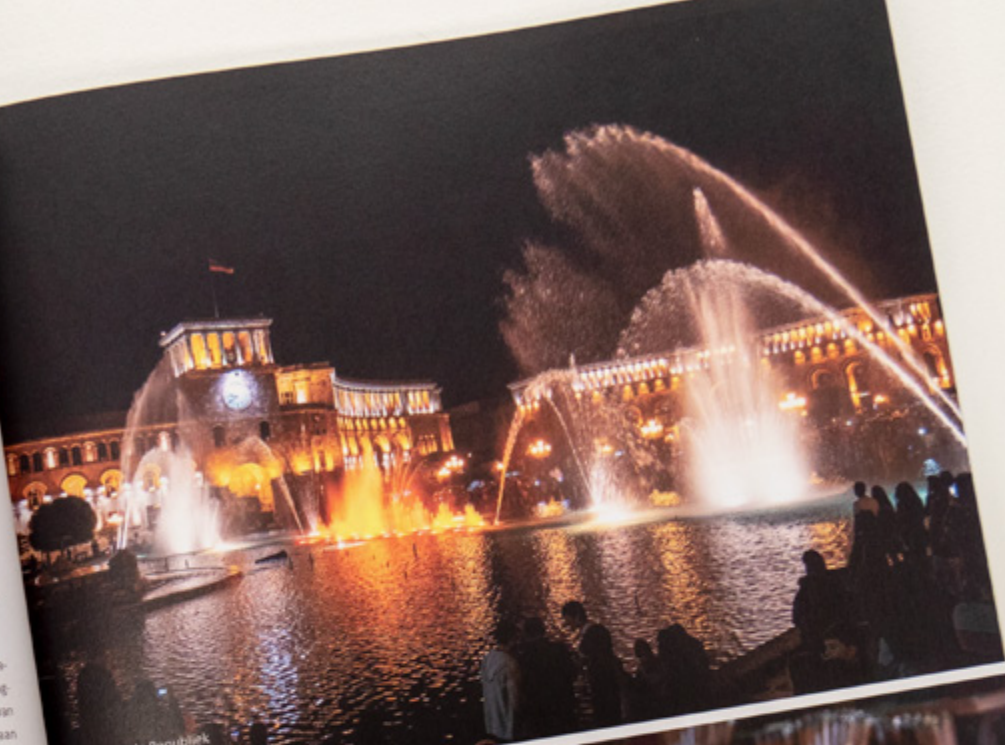
Plein van de Republiek

Het Matenadaran huisvest een unieke manuscripten-collectie, van zowel Armeense alsook niet-Armeense manuscripten. De collectie is een van de oudste manuscripten-collecties ter wereld. Het museum is vernoemd naar Mesrop Mashtots, die in 405 het Armeense alfabet ontwierp. De collectie bestaat uit zo'n 17.000 manuscripten, geschreven in verschillende talen. De handschriften beschrijven bijna alle aspecten van de oude en middeleeuwse Armeense cultuur, geschiedenis, filosofie, literatuur, geografie en geneeskunde. Het Matenadaran is niet alleen een museum, maar ook een onderzoeksinstituut. De collecties worden hier bestudeerd en gerestaureerd. Het oudste manuscript dateert uit 989, het Etsjmiadzin-evangelie. Sinds 1997 staat de collectie op de UNESCO Werelderfgoedlijst voor documenten. Van dinsdag tot en met zaterdag is het museum te bezoeken.