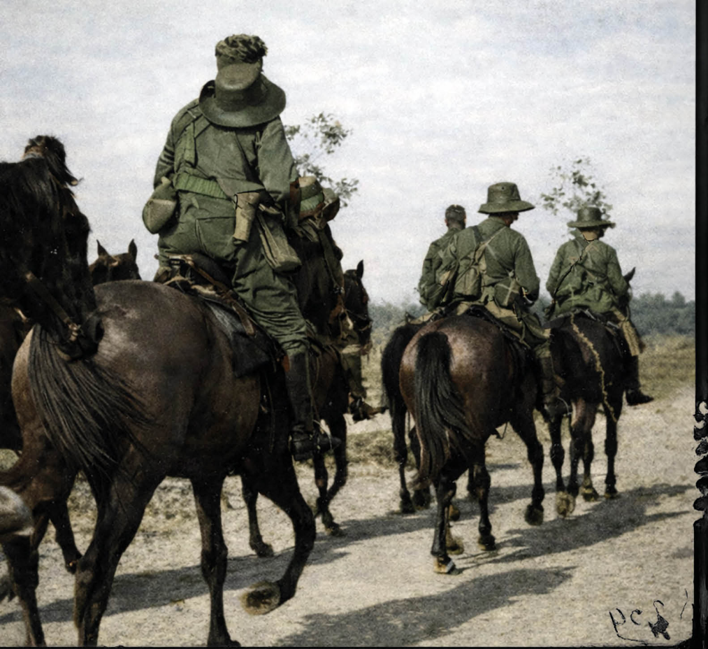
24 oktober 1940 — Vertrek van ruiters tijdens de eerste editie van de TMPT in Nederlands-Indië.