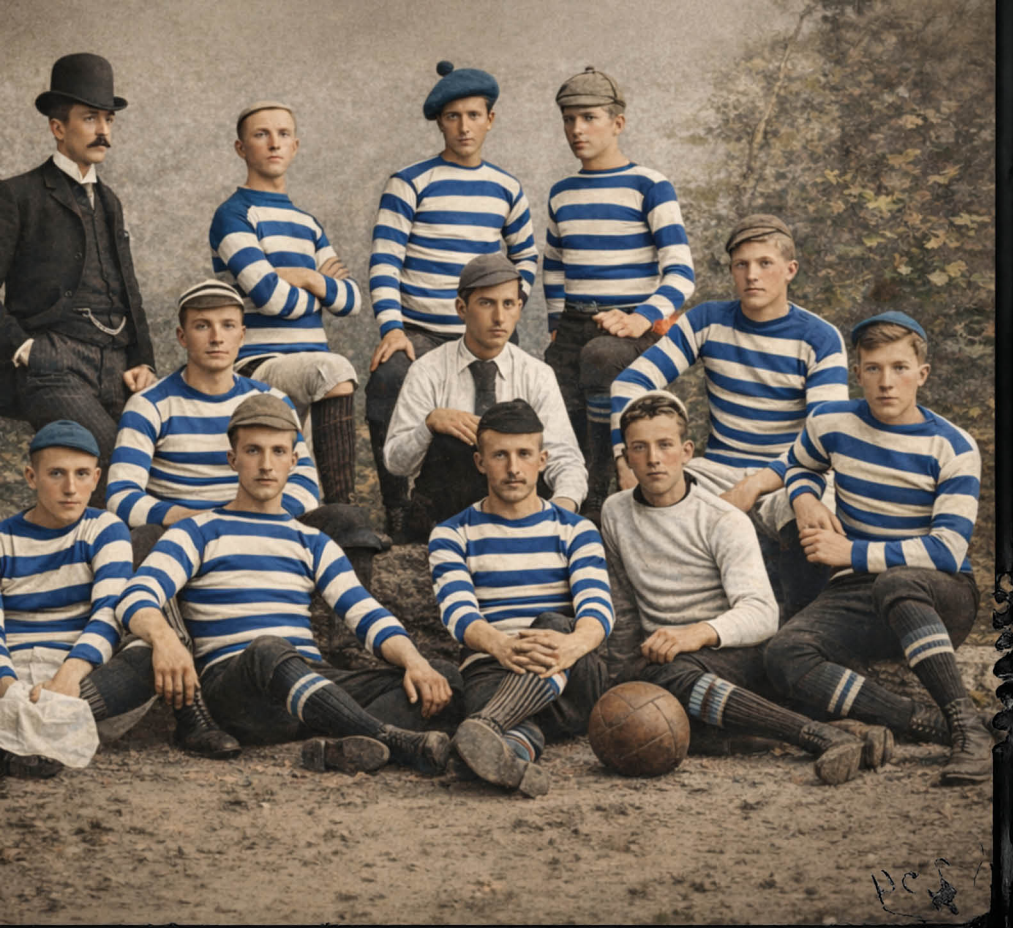
Teamfoto van de Koninklijke HFC uit Haarlem, opgericht in 1879 en erkend als oudste voetbalclub van Nederland.