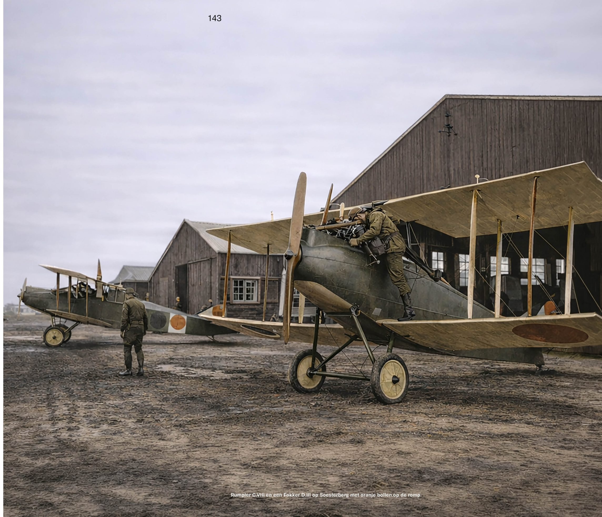
Rumpler C.VIII en een Fokker D.III op Soesterberg met oranje bollen op de romp.