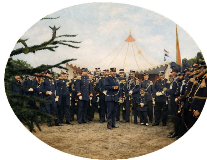
Koning Willem III (middenvoor), prins Hendrik de Zeevaarder (links van de koning), prins van Oranje (achter de koning), te midden van leden van weerbaarheidskorpsen in uniform tijdens de Tweede Nationale Schietwedstrijd, gehouden in de Zwarte Duinen bij De Bilt 16-21 augustus 1869.

W eerbaarheid werd een nationale verantwoordelijkheid, niet alleen een militaire taak. Sport en lichamelijke vorming moesten karakter, verbondenheid en plichtsbesef versterken; het geofende lichaam gold als fundament voor nationale kracht en veiligheid. De wortels van dit denken lagen deels al in de tweede helft van de negentiende eeuw. In de jaren 1866-1867 ontstonden in Nederland schietverenigingen, die door het Rijk werden ondersteund met het oog op militaire voorbereiding. Binnen deze verenigingen ontwikkelden de leden niet alleen hun schietvaardigheid, maar werden zij ook geschoold in militaire discipline, gymnastiek, marsen, exercitie en in de kennis van rangen en uniformen. Daarnaast werd voor de versterking van de volksweerbaarheid een beroep gedaan op het Nederlandsch Gymnastiek Verbond.