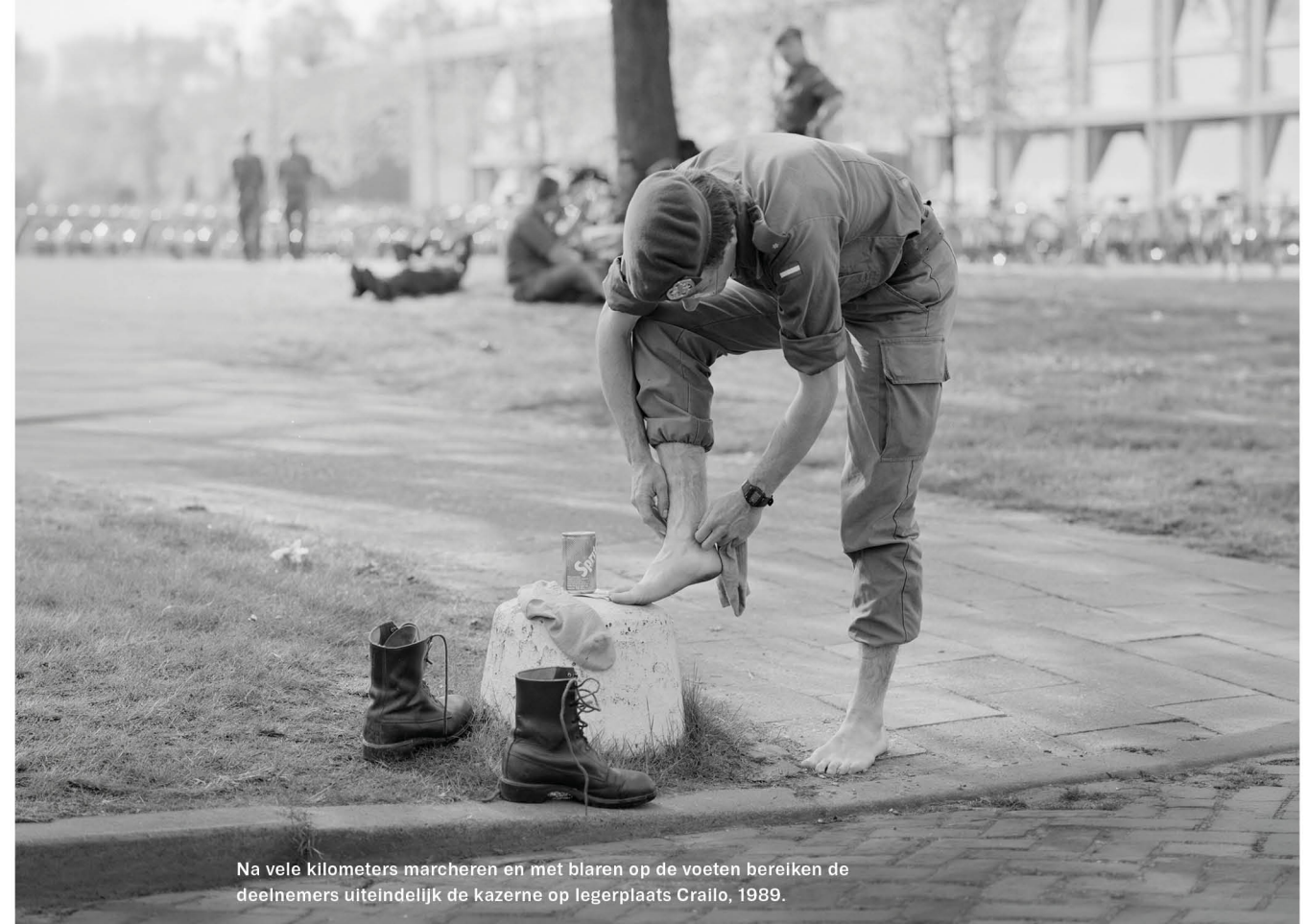
Na vele kilometers marcheren en met blaren op de voeten bereiken de deelnemers uiteindelijk de kazerne op legerplaats Crallo, 1989.