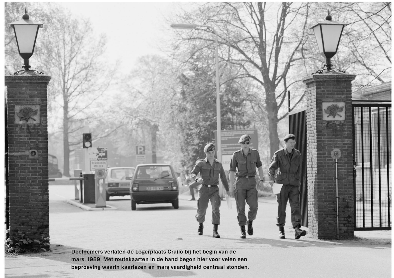
Deelnemers verlaten de Legerplaats Crallo bij het begin van de mars, 1989. Met routekaarten in de hand begon hier voor velen een beproeving waarin kaartlezen en mars vaardigheid centraal stonden.