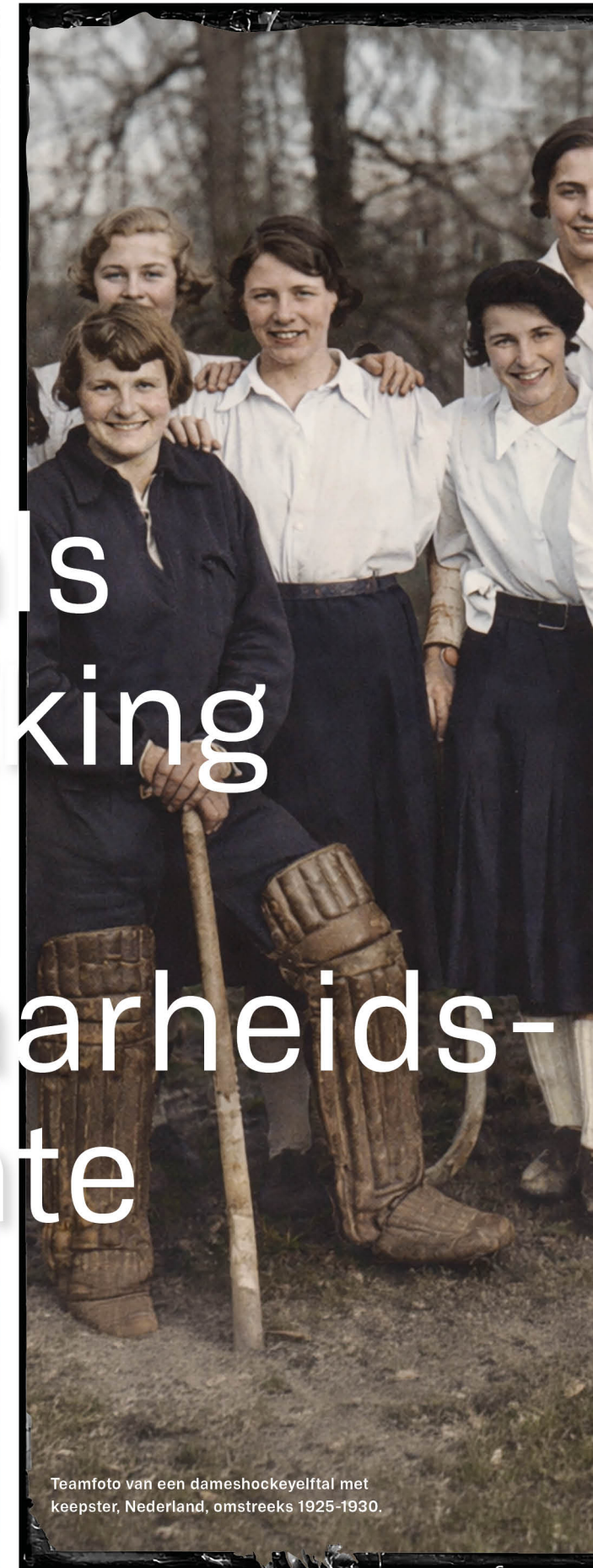
Teamfoto van een dameshockeyelftal met Keepster, Nederland, omstreeks 1925-1930.