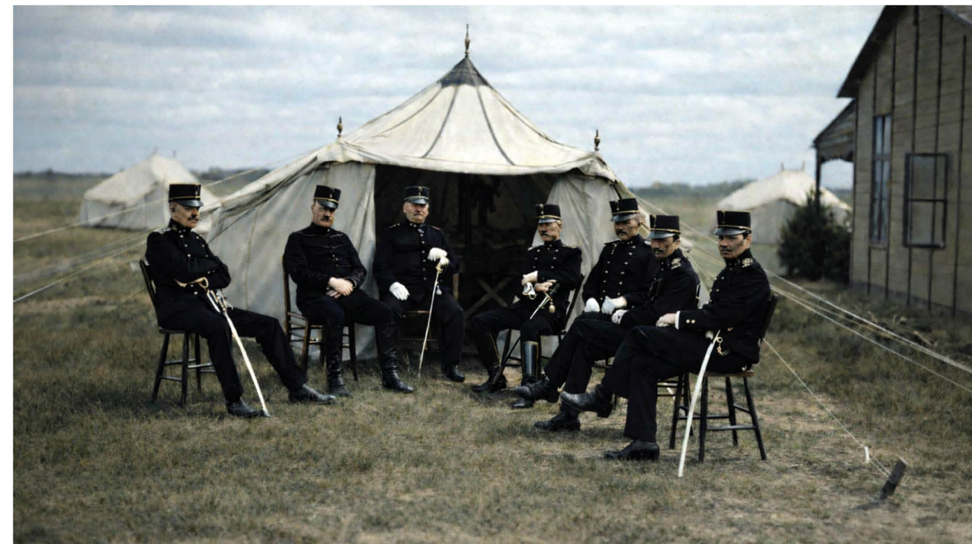
Sport als uitdrukking van de weerbaarheidsgedachte