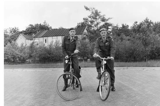
Twee deelnemers aan de TMPT 1956 poseren met hun fietsen voorafgaand aan het vervolg van de tocht.

H oewel het formele besluit uit 1952 de basis legde voor het voortbestaan van de TMPT, kwam het daadwerkelijke initiatief tot hernieuwde organisatie in de jaren daarna vooral vanuit lokale kringen. Een van de eerste concrete signalen daarvan verscheen in 1954, toen het Twentsch Dagblad Tubantia berichtte dat tijdens een ledenvergadering van de afdeling Twenthe van de Algemene Vereniging van Nederlandse Reserveofficieren (AVNRO) was aangekondigd dat men in deze regio voornemens was de eerste naoorlogse TMPT te organiseren. Het hoofdbestuur van de AVNRO was niet op de hoogte van dit plaatselijke initiatief en toonde zich weinig gecharmeerd van deze gang van zaken. Het stelde zich op het standpunt dat de TMPT uitsluitend door de AVNRO zelf georganiseerd mocht worden, zoals ook vóór de oorlog het geval was, en verbood het voorgenomen evenement. De afdeling Twenthe verweerde zich met de mededeling dat zij dit initiatief hadden genomen naar aanleiding van een bijeenkomst in Hengelo, waar de landelijke propaganda- en ledenwerfactie onder de codenaam 'Tinus 200' was besproken en waarbij de