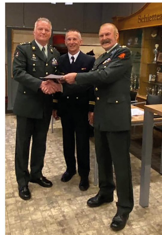
Voortzetting van een traditie

De TMPT had vroeger ook iets weg van een jaarlijkse reünie. Op maandagavond verzamelden officieren van de verschillende krijgsmachtdelen zich traditiegetrouw in de officiersmess op Crailo. Vanaf een uur of zes stroomde het terras vol en de gesprekken, herinneringen en sterke verhalen gingen vaak door tot ver na middernacht. Voor de messbedienden betekende dat een lange avond; de bierpomp draaide onafgebroken. De volgende ochtend begon al vroeg de autotocht van zo'n 140 kilometer door dorpen en steden in Utrecht en Gelderland. Om te voorkomen dat het tempo al te enthousiast werd opgevoerd, had de commissie de Marechaussee ingehuurd om snelheidscontroles uit te voeren. De tocht voerde in alle vroegte door dorpen waar de bakkers net hun ovens hadden opgestookt. De geur van versgebakken brood was voor veel deelnemers onweerstaanbaar. Regelmatig werd er even gestopt bij een bakkerij om de maag te vullen, want een officieel ontbijt op de kazerne ontbrak vaak. Tegen de late ochtend ontving de organisatie dan ook soms telefoontjes van burgemeesters die zich afvroegen waar al dat vroege militaire verkeer ineens vandaan kwam.