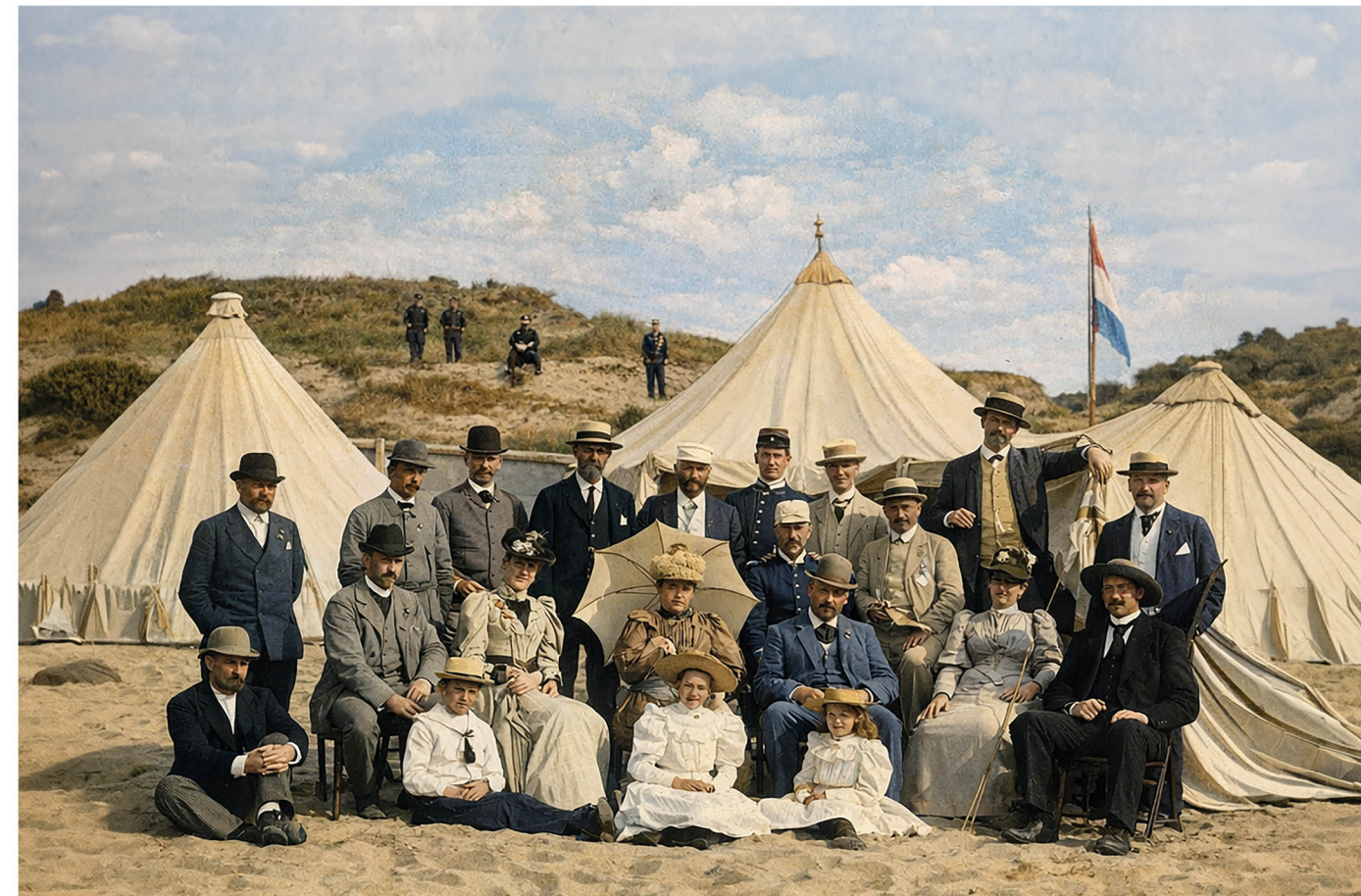
Officieren van de Koninklijke Nederlandse Weerbaarheidsvereniging Volksweerbaarheid, zittend voor een staffent tijdens manoeuvres, kamp Laren, 1912.