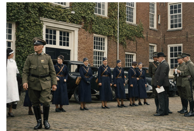
Oefening van het Vrijwillige Landstorm Korps Motordienst. Vertrek van de vrijwilligers uit de Infanteriekazerne aan de Koudenhorn, 24 september 1934.

Daarmee krijgt haar optreden in 1939 een dubbele betekenis. Enerzijds markeert haar naam het eerste vrouwelijke optreden binnen de geschiedenis van de TMPT. Anderzijds laat haar deelname zien dat vrouwen, hoewel zonder rang en buiten het traditionele officierskader, daadwerkelijk onderdeel konden zijn van het militaire bestel van voor 1940. In een krijgsmacht die in structuur en cultuur vrijwel volledig mannelijk was, vormt haar naam een vroege, tastbare aanwijzing van vrouwelijke aanwezigheid binnen de militaire wereld. Haar deelname in 1939 is daarmee niet slechts een curiositeit, maar een klein doch betekenisvol hoofdstuk in de geschiedenis van vrouwen binnen de Nederlandse defensieorganisatie.