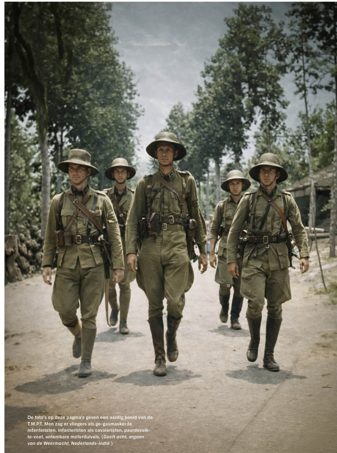
De foto's op deze pagina's geven een aardig beeld van de T.M.P.T. Men zag er vliegers als ge-gasmaskerde infanteristen, infanteristen als cavaleristen, paardevolkte-voet, ontembare motorduivels. (Geeft acht, orgaan van de Weermacht, Nederlands-Indië)

een half uur van elk onderdeel moest worden gereden of gemarceerd met gasmasker in beschermstelling. Op het gasmaskertraject bevonden zich bovendien vier geheime controleposten, listig tussen enkele bamboestruiken verscholen, om te controleren of er tussendoor niet even wat lucht werd gehapt. Met spijt vermeldde de organisatie dat zes deelnemers moesten worden gediskwalificeerd, omdat zij tegen de voorschriften inzake het dragen van het gasmasker hadden gezondigd. Dergelijke overtredingen konden niet worden geduld. De onverbiddelijke handhaving van de gasmaskervoorschriften was geen detail, maar een weerspiegeling van het heersende paraatheidsdenken in 1940, toen de angst voor gasoorlogvoering, gevoed door ervaringen uit de Eerste Wereldoorlog, reëel en alomtegenwoordig was.