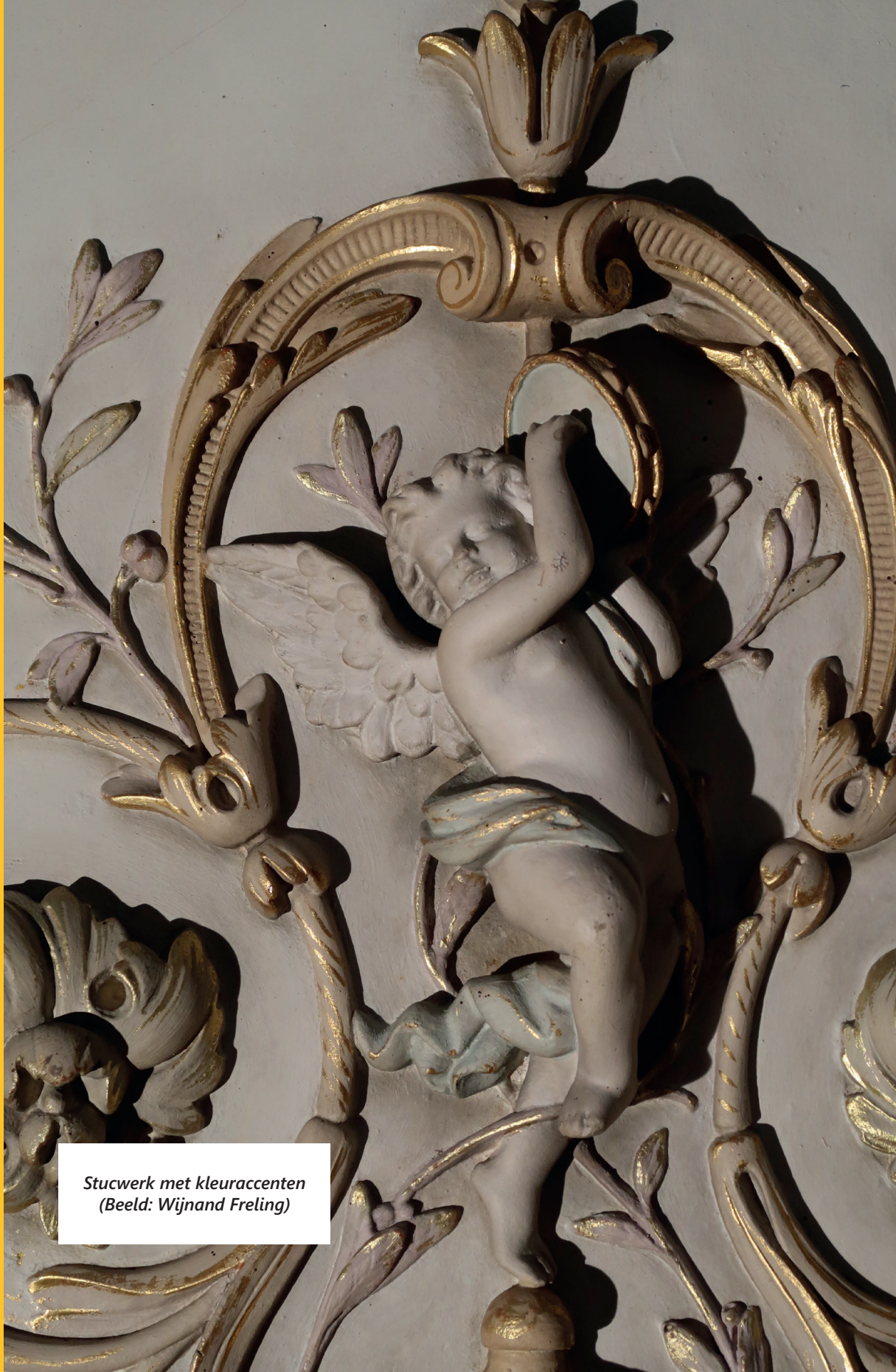
Stucwerk met kleuraccenten