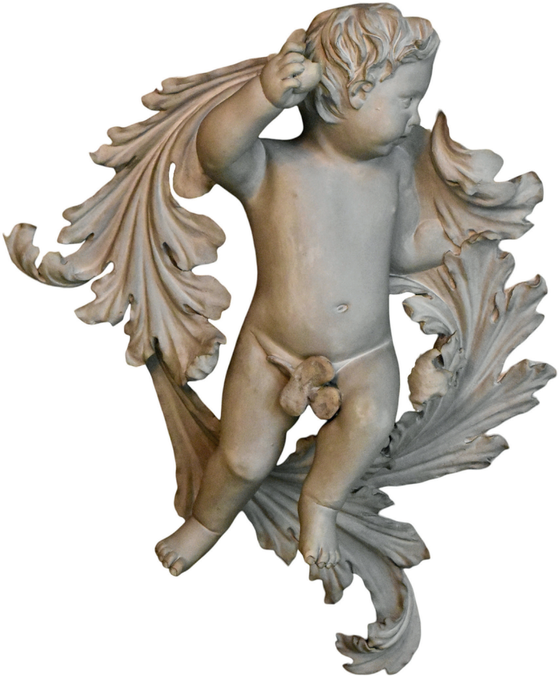
De putti in een van de vroegste stucplafonds van Amsterdam (Nieuwe Herengracht 99, rond 1700) waren oorspronkelijk naakt gemodelleerd, maar moesten in een latere periode voor bescherming van de zedelijkheid bedekt worden.