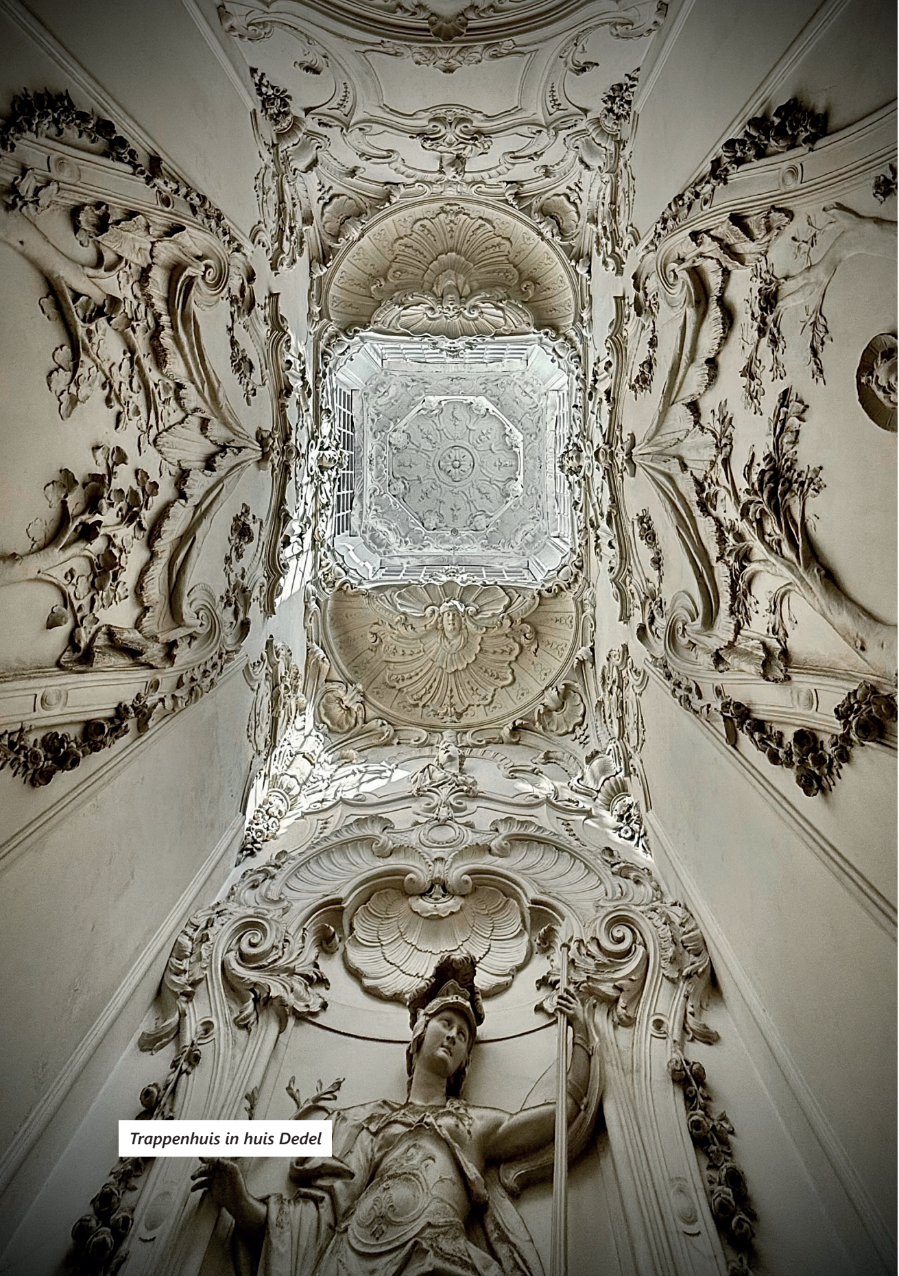
Trappenhuis in huis Dedel