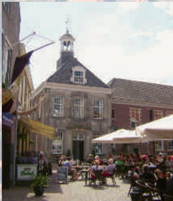
Van Jagen tot bekeren

Ootmarsum is een oude Twentse stad, die volgens de overlevering het bestaan dankt aan de Frankische edelman Othmar. Hij zou in 126 na Christus hier een woonruimte hebben opgetrokken, 'Othmars heim', later verbasterd tot Ootmarsum. De Angelsaksische missionaris Marcellinus koos omstreeks 700 deze plek uit om een houten kerkje te bouwen. De rest van de stad plooide zich er gaandeweg omheen. Ootmarsums bestuurlijke gewicht nam toe met de komst van een meiershof, van waaruit de bisschop zijn landerijen kon beheren. In het midden van de dertiende eeuw bouwden de Ridders van de Duitse Orde, oorspronkelijk een orde van kruisvaarders, er bovendien een Commanerie, het latere Huis Ootmarsum. Stadsrechten kreeg Ootmarsum in 1325. Tegenwoordig onderscheidt het stadje zich als toeristisch en kunstzinnig centrum.