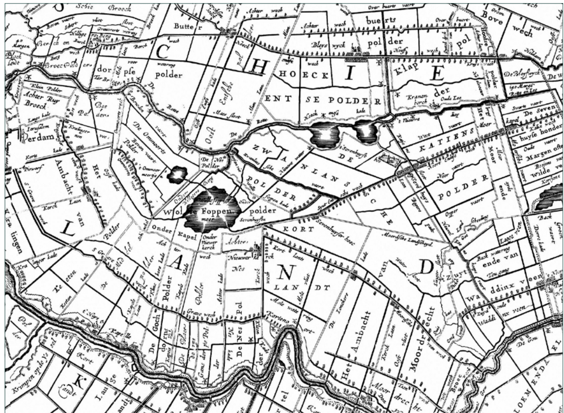
Kaart van het gebied ten oosten van Rotterdam, tussen Rotte en IJssel, door Jacob Aertsz Colom, 1639.

Het moerassige land wordt door ontginning steeds meer geschikt gemaakt voor bewoning en gebruik. Het land wordt verdeeld in weren, lange stroken die gescheiden zijn door sloten, die zorgen voor de afwatering van het drassige land. In de late Middeleeuwen beginnen dorpsbewoners het veen af te graven. Al sinds de tiende eeuw is bekend dat afgestoken veengrond in gedroogde vorm uitstekende brandstof is. Het turfsteken wordt op steeds grotere schaal toegepast.