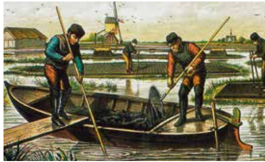
Op een plaat zoals deze vroeger in schoolklassen hing, zijn turfstekers met baggerbeugels in de weer.

Om in de toenemende vraag te kunnen voorzien moet de winning van turf grootschaliger worden aangepakt. Dat betekent een impuls voor de veenafgravingen in de regio. Vanaf omstreeks 1550 stijgt het volume van de veenafgraving fors. Zowel ten noorden als ten oosten van Rotterdam wordt steeds meer veengrond afgegraven. Dit gebeurt boven de grondwaterspiegel, ook wel