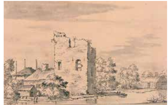
Boven: Het slot Honingen en de ruïne rond 1750.