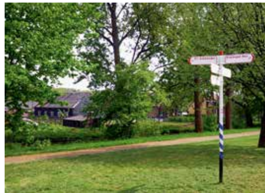
Kralings grondgebied: het Venhoeve-complex aan het Lagelandsepad anno 2009, vlakbij een toegang naar het Kralingse Bos.

Bestuur Historische Vereniging Prins Alexander (HVPA)