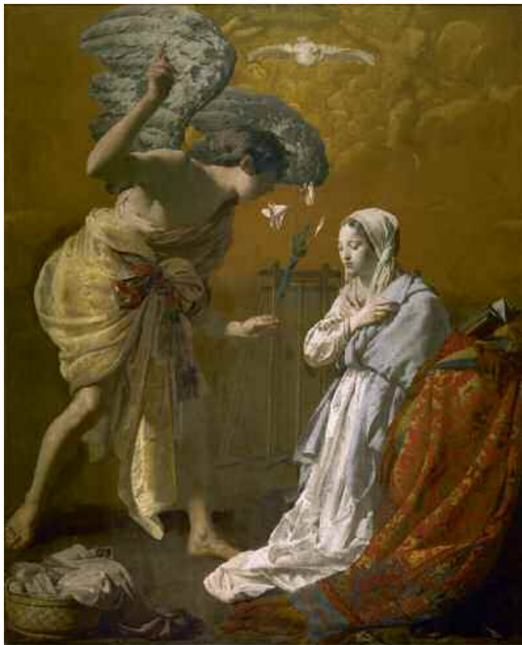
1 Hendrick ter Brugghen, Annunciatie, 1629. Stadsmuseum De Hofstadt, Diest, bruikleen OCMW, Diest.