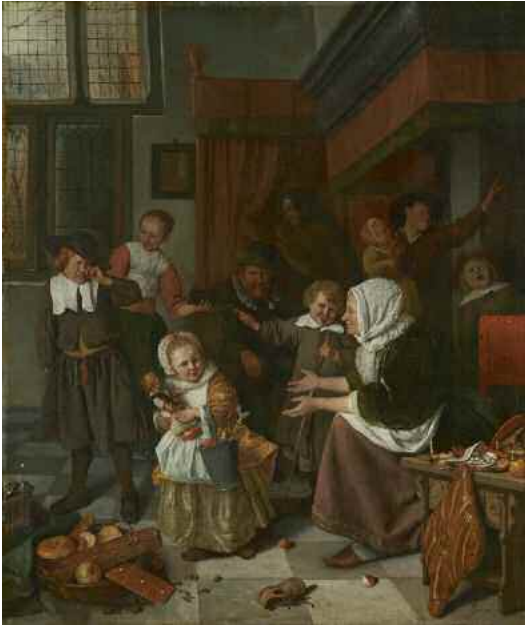
51 Jan Steen, Het Sint-Nicolaasfeest , 1665-1668. Rijksmuseum, Amsterdam, SK-A-385.