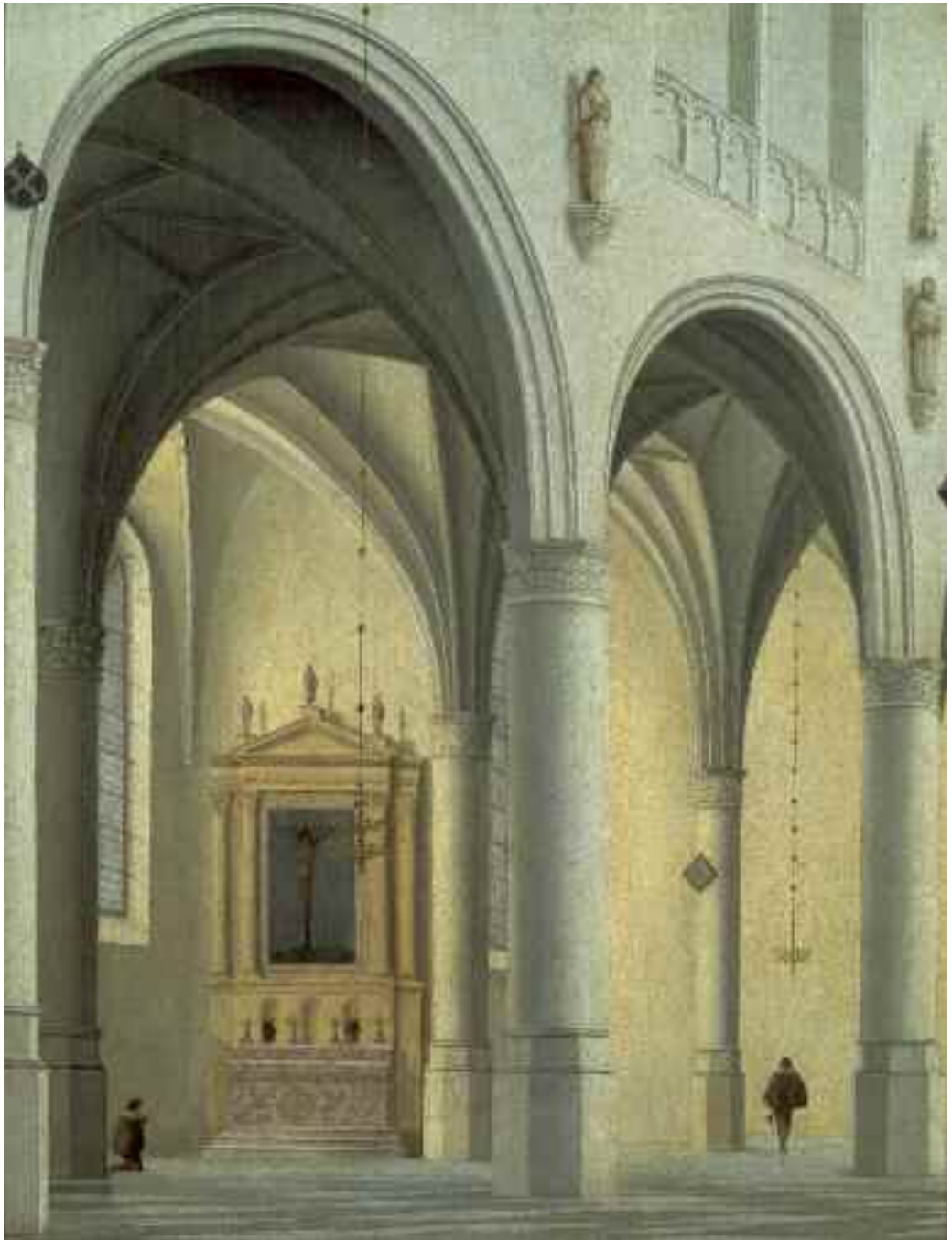
35 Pieter Saenredam, Gezicht op een kapel in de noordelijke zijbeuk van de Grote of Sint-Laurenskerk te Alkmaar , 1635. Museum Catharijneconvent, Utrecht, BMH 5124, foto Ruben de Heer.