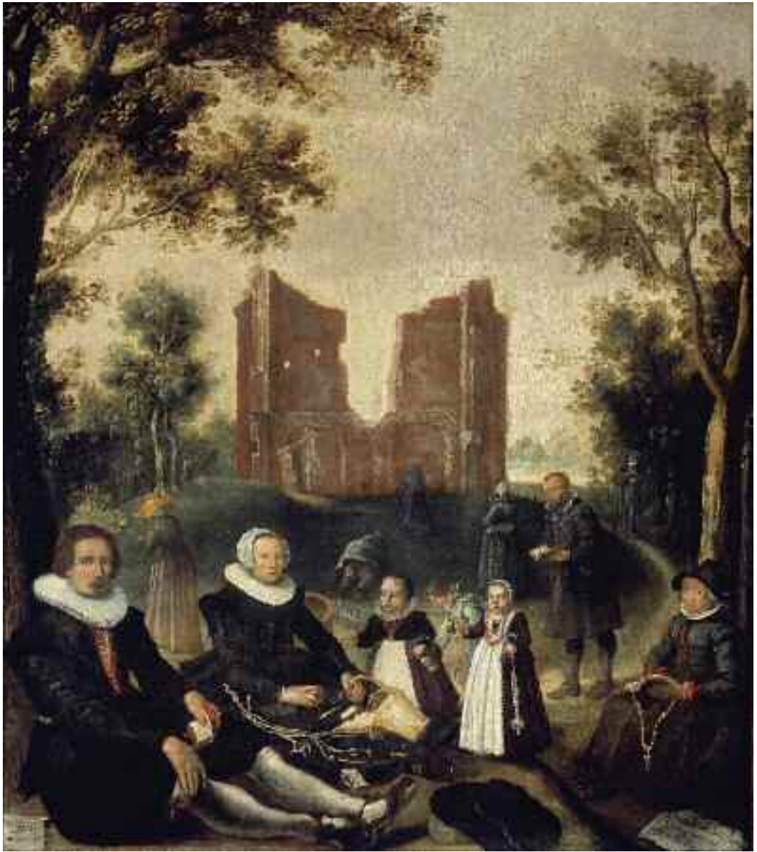
34 Gerrit de Jongh, Portret van een familie voor de ruïne van de kapel van Onze-Lieve-Vrouw ter Nood te Heiloo, 1630. Museum Catharijneconvent, Utrecht, ВМН s473b, foto Ruben de Heer.