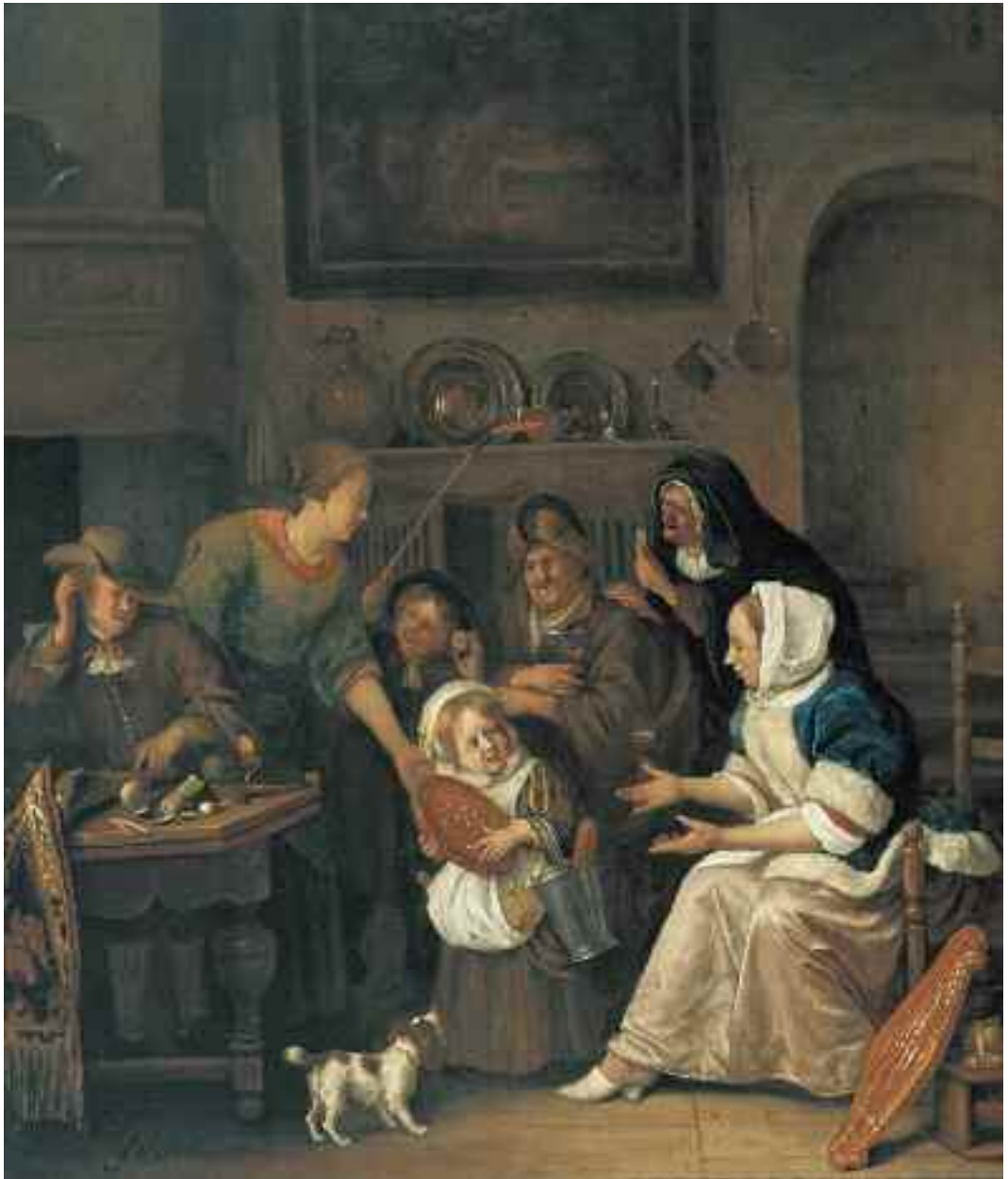
52 Jan Steen, Het Sint-Nicolaasfeest , ca. 1668. Museum Catharijneconvent, Utrecht, RMC 5325, bruikleen Museum Boijmans van Beuningen, Rotterdam.