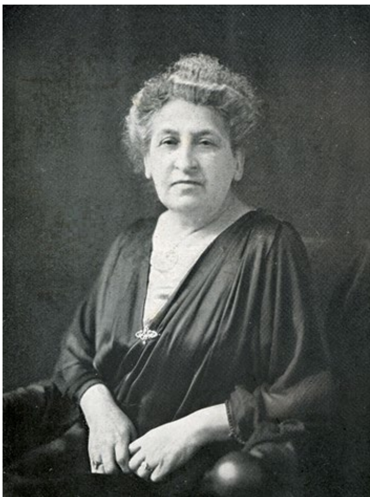
Dr. Aletta H. Jacobs op haar zeventigste geboortedag.