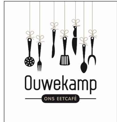
De logo's van 'Ouwekamp, ons eetcafé' en 'Austerlitz Duurzaam' en de openingspagina van de website van 'Lokaal Austerlitz'.