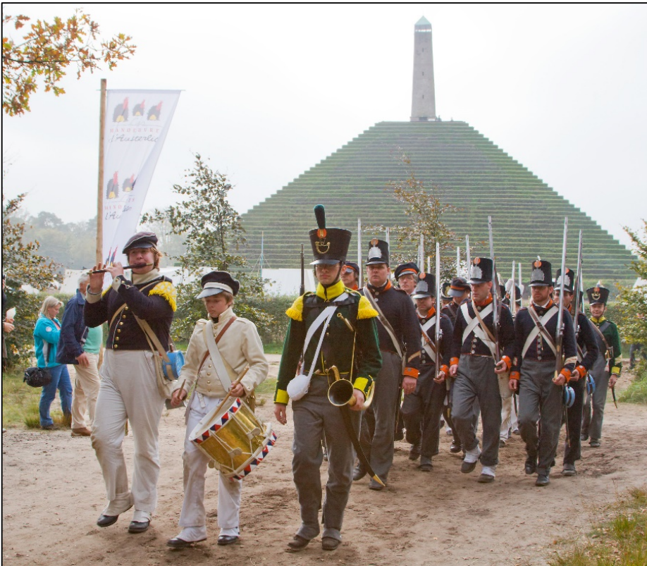
Tijdens 'Les Manoeuvres d'Austerlitz' bij de Pyramide, in 2008

Marmont had de marktkooplui en handelaren achter iedere divisie een plek toegewezen. Zo waren er drie concentraties ontstaan die zelf hun onderkomens (plaggenhutten) hadden gebouwd. Deze gehuchten waren Petitville in het westen, Marmontville in het midden en Bois-en-Ville in het oosten. Toen het kamp verlaten was viel er voor de inwoners van de drie nederzettingen niets meer te verdienen. Een aantal verliet het kamp, een aantal bleef. Degenen die overbleven stond een armoe-dig bestaan te wachten. Koning Lodewijk Napoleon besloot de drie gehuchten samen te voegen tot één plaats. Dit besluit viel op 17 augustus 1806 en de plaats kreeg van Lodewijk Napoleon de naam 'Austerlitz' ter ere van de overwinning van zijn broer Napoleon bij de Driekeizersslag bij Austerlitz in het huidige Tsjechië, december het jaar daarvoor. Lodewijk Napoleon bepaalde verder, dat er altijd een garni-