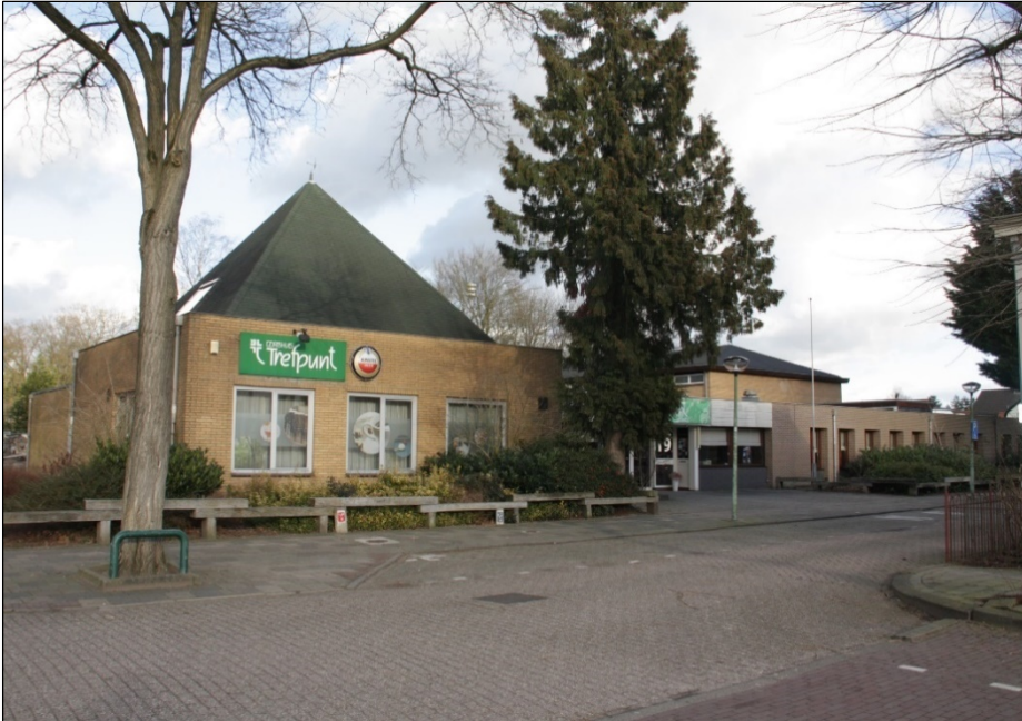
Dorpshuis 't Trefpunt.

Ook daarna zijn steeds verenigingen opgericht, maar in een rustiger tempo. We gaan ze niet allemaal noemen. De belangrijkste zijn Zangvereniging 'Ons Genoegen' (1922), later omgedoopt tot 'Cantiamo', de Floraliavereniging (1935, in 2011 opgeheven) en Sportvereniging Austerlitz (1934).