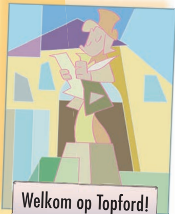
Welkom op Topford!