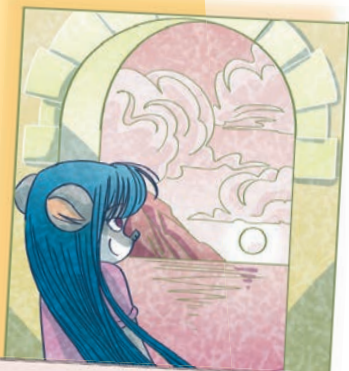
Zonsondergang op Topford