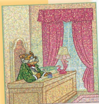
De rector aan het werk