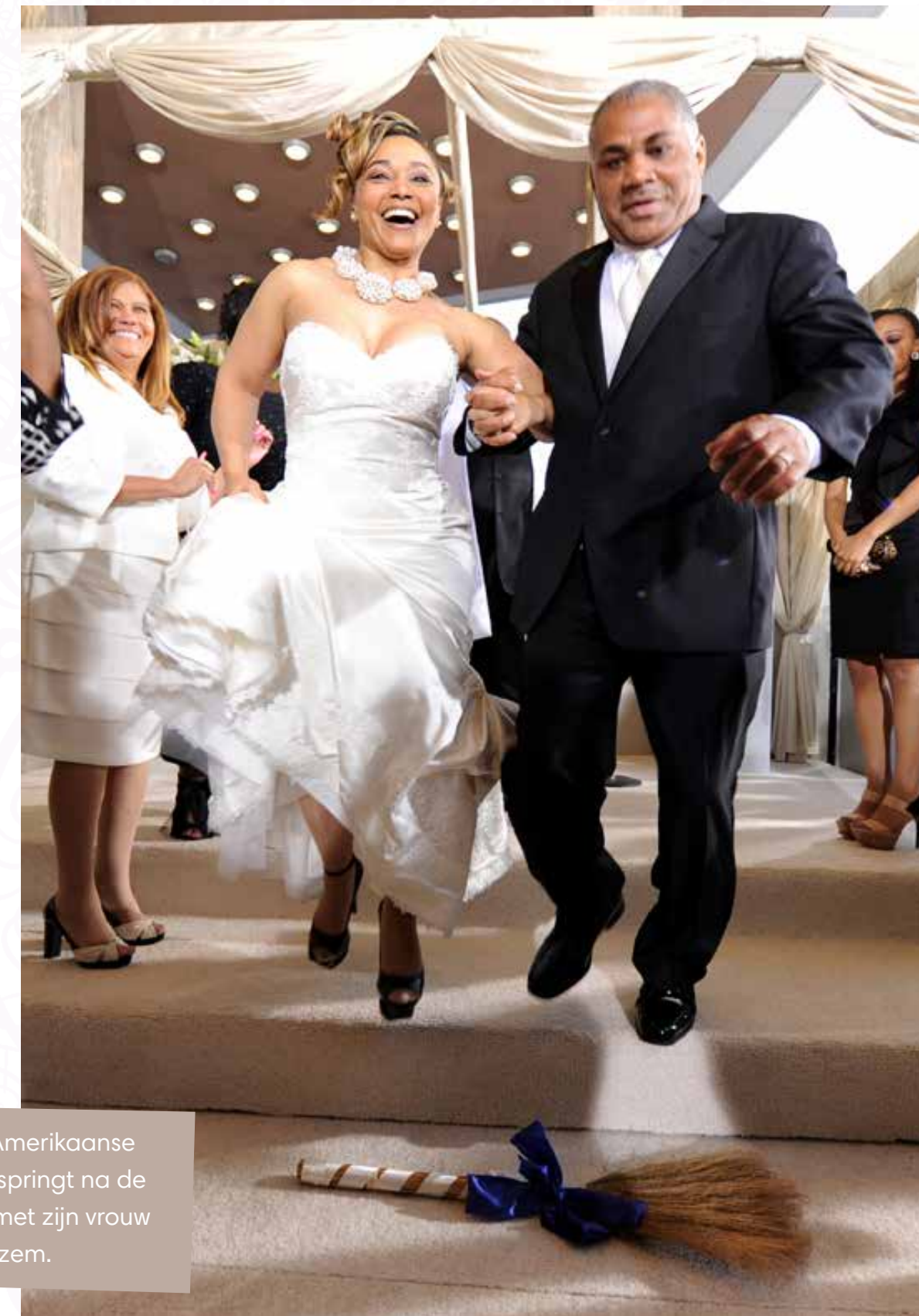
Deze Afro-Amerikaanse bruidegom springt na de ceremonie met zijn vrouw over een bezem.

In sommige Afro-Amerikaanse families eindigt de huwelijks-ceremonie met een sprong over een bezem. Dit komt uit de tijd van de slavernij , toen slaven niet mochten trouwen. Met de bezemsprong lieten ze zien dat ze samen wilden zijn.