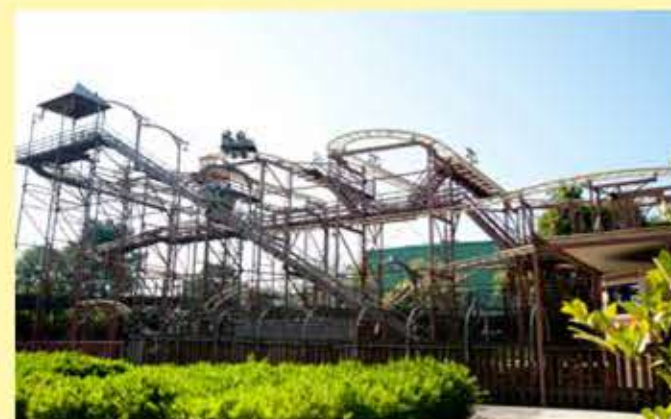
de Speedy Bob, een wildemuis-achtbaan in Bobbejaanland, Lichtaart, België.

De vierdimensionale achtbaan Eejanaika in Fujiyoshida, Japan, laat de passagiers wel veertien keer over de kop gaan! Het gaat om twee loopings en twaalf rotaties van de stoeltjes.