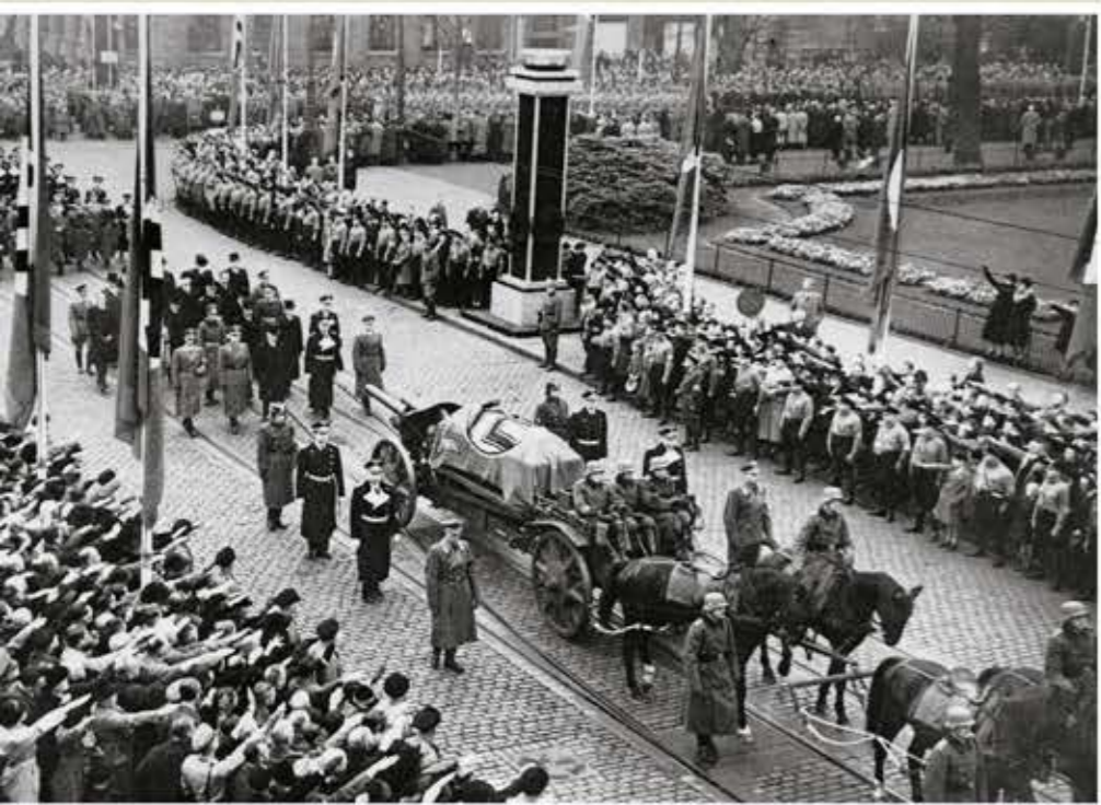
● Hitler was bij de begrafenis van Ernst vom Rath in Düsseldorf, Duitsland.

Op 7 november werd Ernst vom Rath, een medewerker van de Duitse regering, neergeschoten in Parijs. Hij overleed twee dagen later. De dader was de Pools-Joodse tiener Herschel Grynszpan. Hij was kwaad, omdat Poolse Joden die in Duitsland woonden door de nazi's het land waren uitgezet. Onder hen waren zijn ouders, broer en zus. Ze hadden hun huis en al hun bezittingen moeten achterlaten.