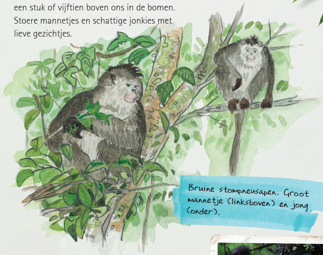
Bruine stompneusapen. Groot mannetje (linksboven) en jong (onder).

En na het oversteken van twee bergketens in de Himalaya, een verdwaaipartij in bergweiden en een motorrit middenin een aardverschuiving hadden we ze plots gevonden. Er zitten er een stuk of vijftien boven ons in de bomen. Stoere mannetjes en schattige jonkies met lieve gezichtjes.