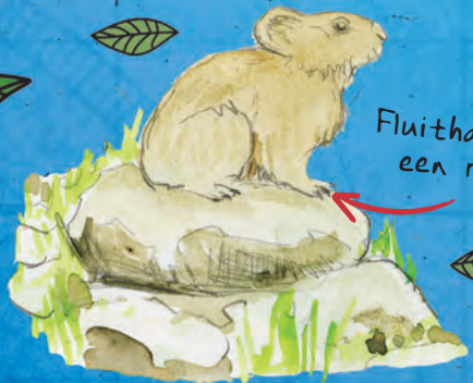
Fluithaas op een rots

Geschreven en getekend door ontdekkingsreiziger Simon Chapman