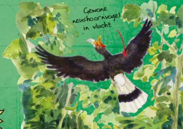
Gewone neushoornvogel in vlucht