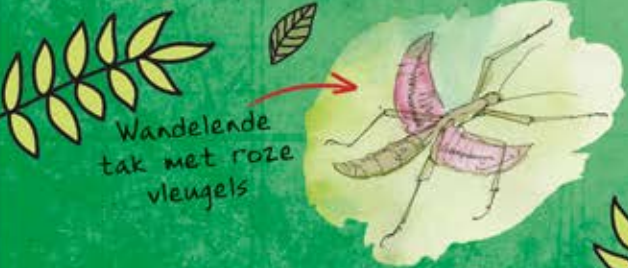
Wandelende tak met roze vleugels