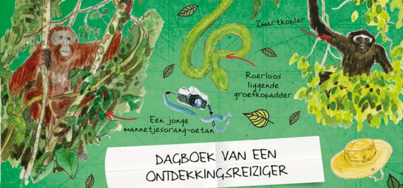
Een jonge mannetjesorang-oetan