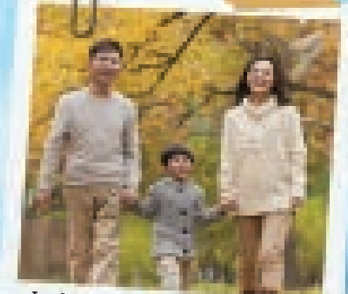
In de tijd van de 'eenkindpolitiek' kon je gestraft worden als je een tweede kind kreeg.

In 1979 besloot de Chinese regering dat de bevolking te snel groeide en dat het land dit niet aankon. Er kwam een wet die bepaalde dat een stel maar één kind mocht krijgen. Door dit beleid heeft China nu een bevolking met veel ouderen – tegen 2050 zal één op de vier Chinezen 60 jaar of ouder zijn. Tegenwoordig wil men het aantal geboortes juist weer laten stijgen.