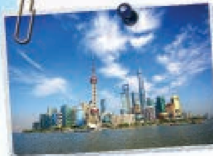
De Shanghai Tower is de buisvormige wolkenkrabber rechts op de foto.

Tussen 1420 en 1911 hebben er in de Verboden Stad 24 keizers gewoond.