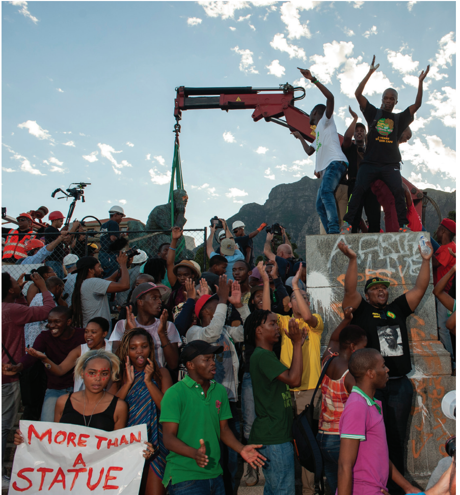
Verwijdering van het beeld Cecil John Rhodes van de campus van UCT Kaapstad op 9 april 2015.