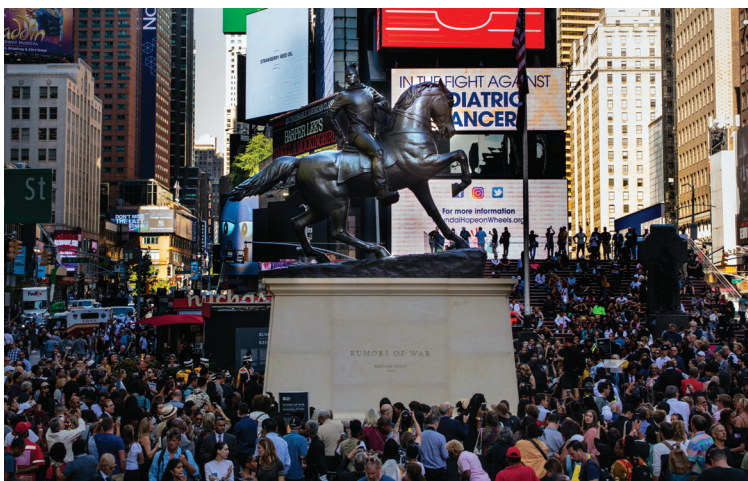
Kehinde Wiley, Rumors of War , 2019, gepresenteerd op Broadway Plaza, New York door Times Square Arts i.s.m. Virginia Museum of Fine Arts en Sean Kelly.

kerken en instituten vol nostalgie naar de ‘zuidelijke’ levenswijze was nog in 1997 aangemerkt als National Historic Landmark . Om de hoek van Monument Avenue stond op 10 december 2019 een juichende menigte verenigd om een standbeeld dat verdacht veel leek op het standbeeld van de Confederale generaal J.E.B. Stuart. Het was de inhuldiging van Rumors of War van Kehinde Wiley, een zwart beeld van een jonge African American ruiter met dreadlocks die de oude generaal persifleerde. Die eigenzinnige overwinning op de vernedering van zwarten, een opdracht van