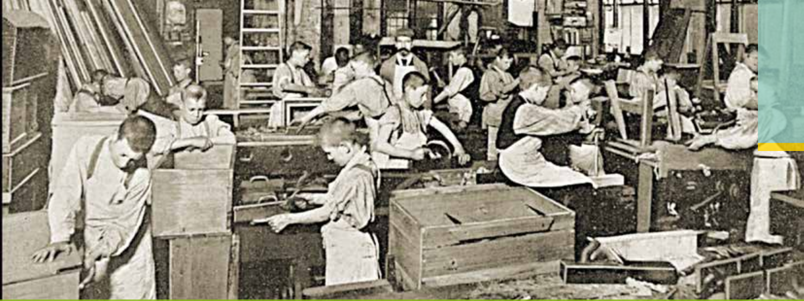
▲ In de 19 e eeuw werkten veel kinderen in fabrieken.