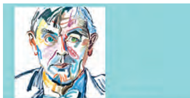
Stichting Rudolf H. Schmidtfonds