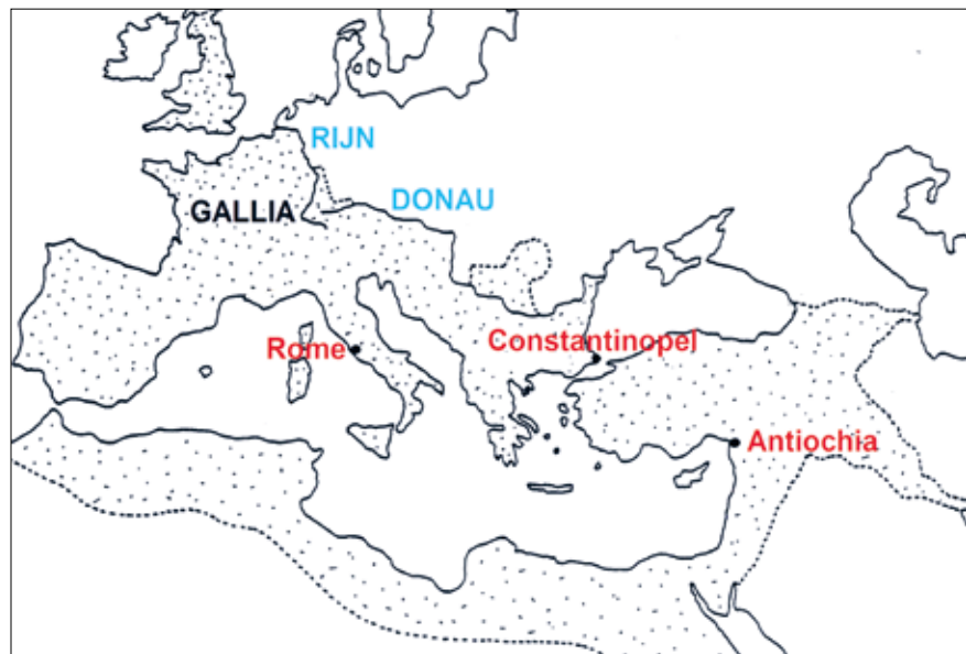
Het Romeinse Rijk in zijn grootste uitbreiding, ten tijde van keizer Trajanus. ►

De belangrijkste bron voor onze kennis van de Romeinse wegen is zonder twijfel de Peutingerkaart, een middeleeuwse kopie van een Romeinse wegenkaart, die de hoofdwegen in het hele Rijk aangeeft met halteplaatsen en onderlinge afstanden. Deze kaart zal als leidraad worden gebruikt voor het verdere onderzoek. Vandaar dat Deel I van dit werk een uitgebreide bespreking van die kaart bevat.