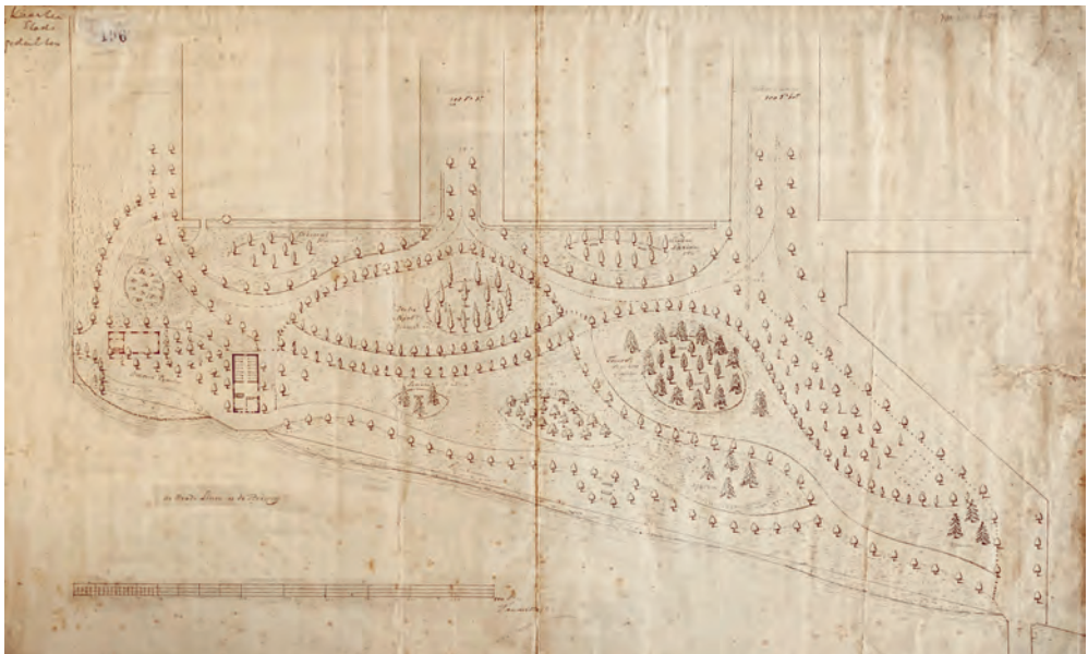
Afb. 4 Abraham van der Hart, Bepantingsplan van het wandelpark in de Plantage in Amsterdam , 1812 (SAA, toeg.nr. 10033, inv.nr. 2957).