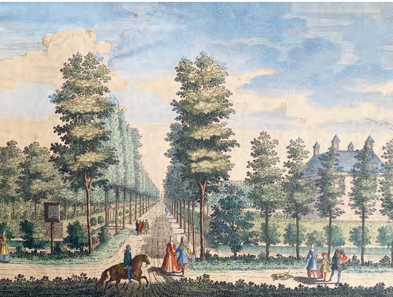
Afb. 1 Daniël Stopendael, Zorgwijk, de Hofstede van den Hr. Gilles van Hoven ziende door den Middel wegh naer de Stadt , 1725 (Particuliere collectie).

lingen in de Hollandse stad werden aangelegd. Van begin af aan werd de aanwezigheid van de bomen geassocieerd met wandelen.