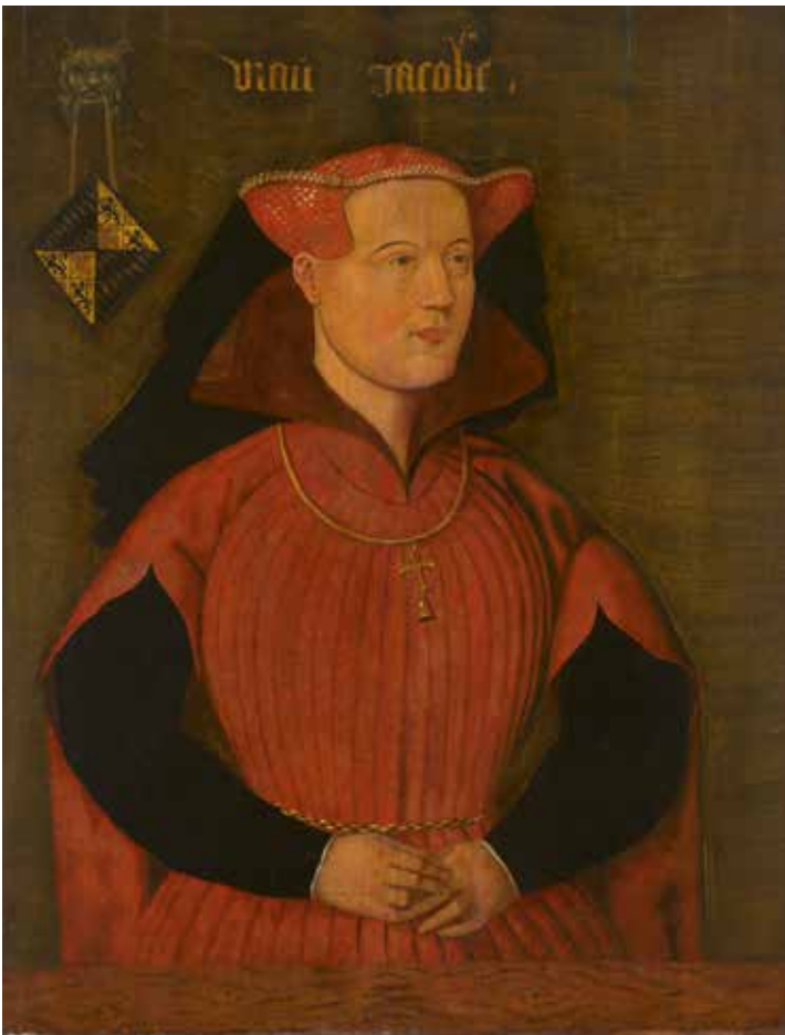
2. Portret van Jacoba van Beieren (olieverf, 64 x 50 cm, ca. 1490).