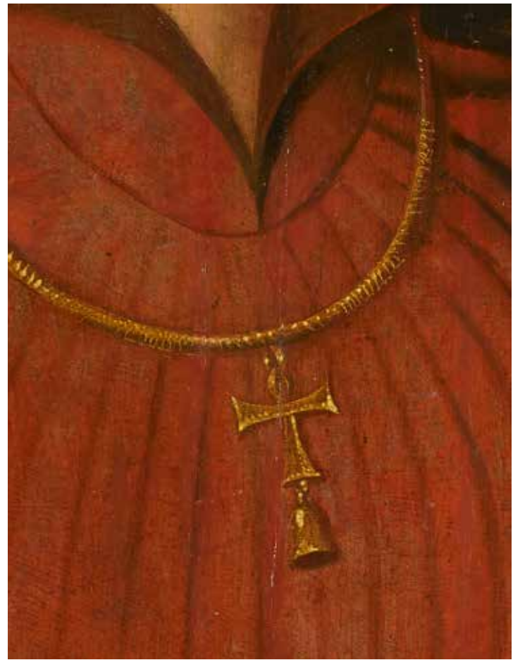
3. Detail: afb. 2, het Sint-Antonius ordeteken.

inkomsten eind 1466 definitief geregeld waren en er van een zelfstandige Scheveningse parochie gesproken kon worden. Huych Lambrechtsz. was vanaf 1419 de eerste eigen pastoor van de Scheveningse Antonius Abtkapel, welke in de loop van de 15 e eeuw vervangen zou gaan worden door een stenen Antonius Abtkerk.