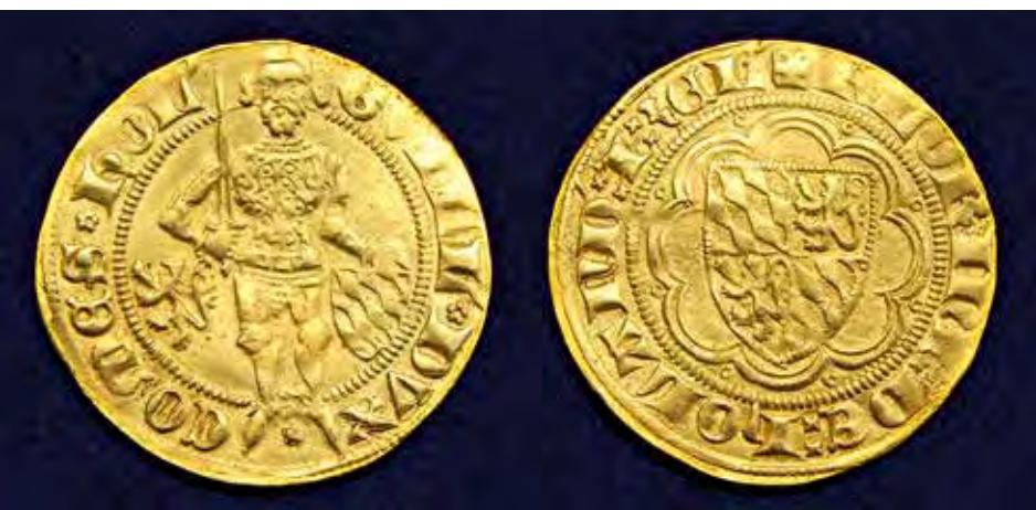
1. Hollandse goudgulden van Willem van Beieren, die als Willem V van 1348 tot 1389 tevens graaf van Holland was.

Ook nadat in 1419 de hoogstwaarschijnlijk houten Antonius Abtkapel tot Scheveningse parochiekerk verheven was, 7 bleven er wel conflicten op kerkelijk gebied ontstaan. Zo moest men nog steeds aan de pastoor van de Haagse St.-Jacobskerk, als schadeloosstelling voor het verlies aan inkomsten, jaarlijks een bedrag van 24 pond betalen. Na 1419 zijn er meerdere rechtszaken nodig geweest, eer de verdeling van de bezittingen en alle aanspraken op