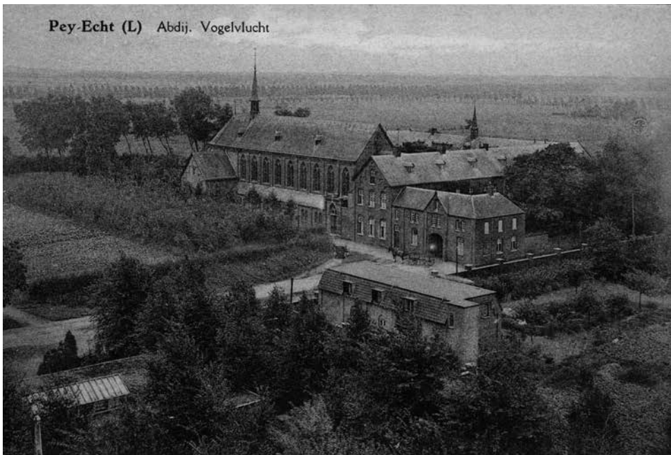
Lilbosch rond 1900

Het waren in ieder geval weinig benijdenswaardige omstandigheden waarin Anselmus kwam te verkeren. Hij was nog net geen 38 jaar en pas twee jaar eerder tot priester gewijd.