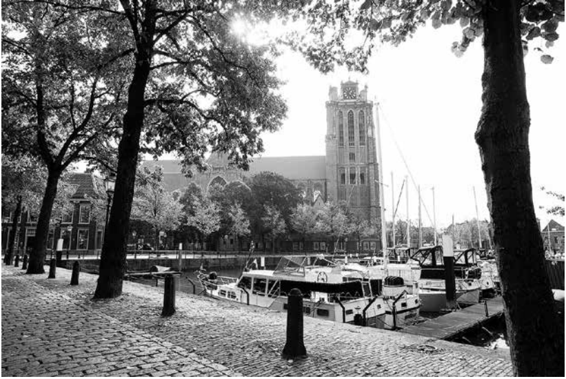
De Grote Kerk van Dordrecht.