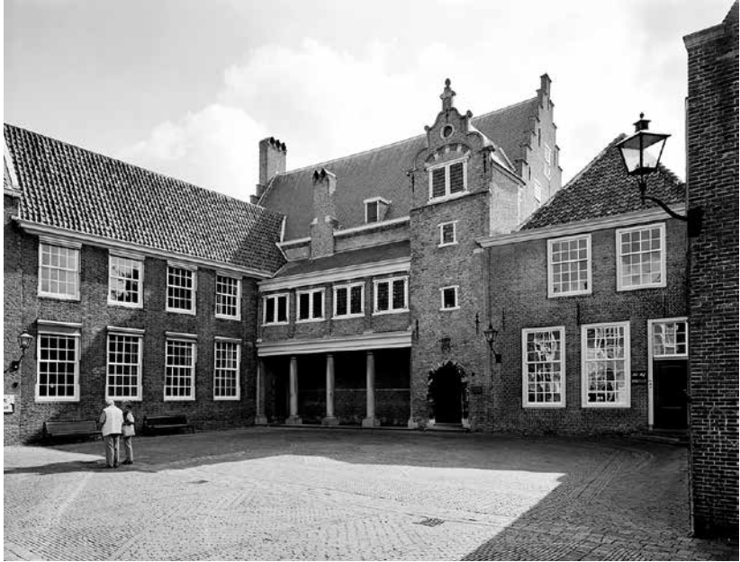
De zaal in het Dordtse Augustijnenklooster waar van 15-24 juli 1572 onder voorzitterschap van prins Willem van Oranje de eerste vrije vergadering van de Staten van Holland werd gehouden.

de belangrijkste synode die ons land ooit heeft gekend, aldaar zou worden gehouden.