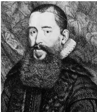
Balthasar Lydius sprak de openingsrede uit bij de Dordtse synode.