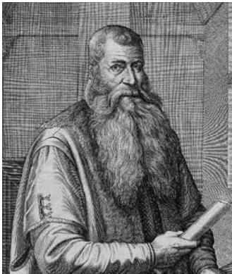
Johannes Bogerman, voorzitter van de synode.