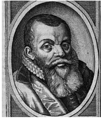
Conrad Vorstius volgde Arminius op als hoogleraar in Leiden, na diens overlijden.