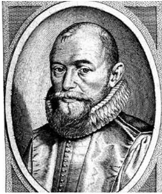
Simon Episcopius was de woordvoerder namens de remonstranten tijdens de synode van 1618-1619.

Nadat de buitenlanders waren vertrokken, hebben de Nederlandse afgevaardigden zich nog gedurende 26 zittingen beziggehouden met allerlei zaken die om afhandeling vroegen. De belangrijkste was het opstellen van een kerkorde. Tevens is de tekst van de Nederlandse Geloofsbelijdenis en de Heidelbergse Catechismus alsmede van de liturgische geschriften vastgelegd.