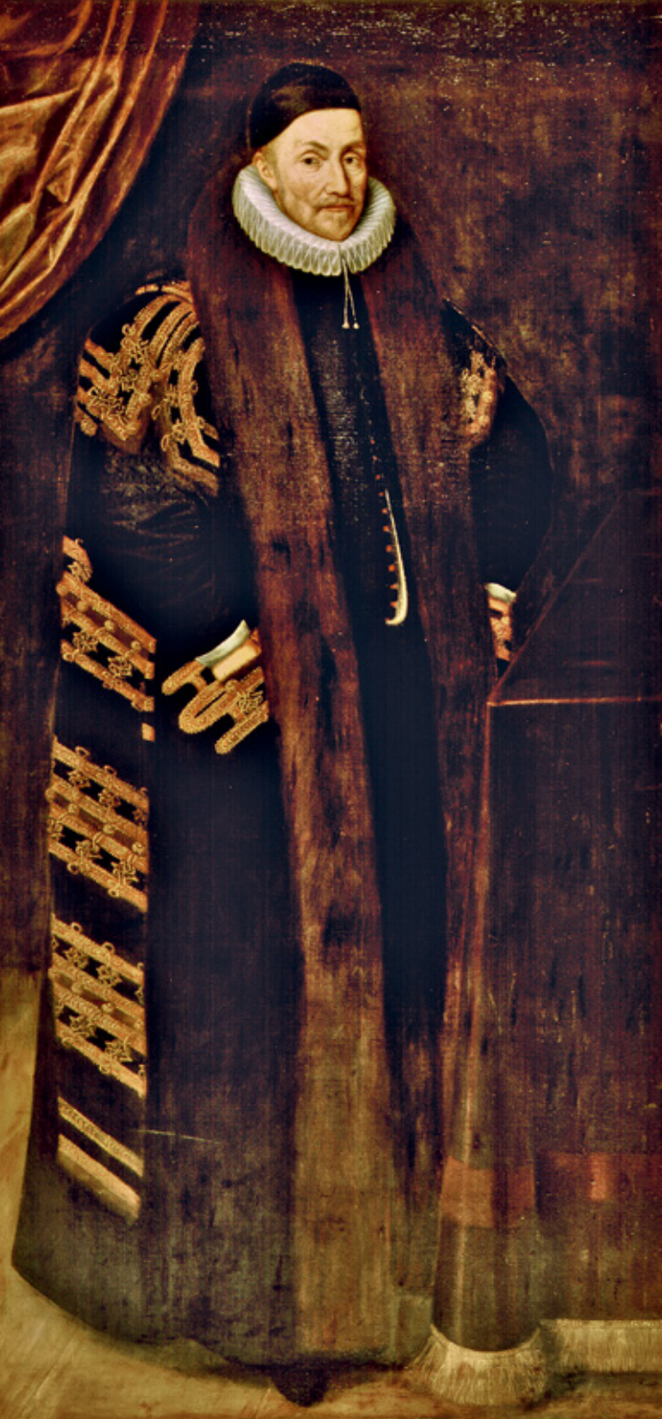
Stichter van de universiteit, prins Willem van Oranje, door Daniël van den Queborn, 1598. Het portret hangt nu in de Togakamer.