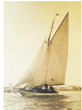
De García (1919)