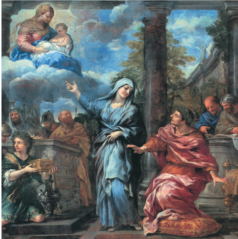
1.4. De Sibylle van Tibur kondigt keizer Augustus de geboorte van Christus aan. Schilderij van Pietro da Cortone uit 1660.

Reeds keert gerechtigheid weer, weer keert Saturnus' heerschappij 5 , Reeds daalt het jonge kind uit hoge hemel neer. Gij reine Lucina 6 , wees gij de knaap nabij in het geboorte-uur, waarin de mensheid, hard als ijzer, zal verdwijnen 10 en over heel de aard het gouden rijk verschijnen 7 . Reeds heerst uw broer Apollo. Onder uw consulaat, Pollio, zal deez' heerlijke tijd zijn aanvang nemen en zal het grote wereltijdperk zijn loop beginnen. Onder uw leiding zal, zo daar nog enig spoor blijft van ons wanbedrijf, 15 dit worden uitgedelgd 8 en zo zullen de landen verlost worden van gestage angst. Hij zal der goden leven ontvangen en onder de goden zal hij de helden 9 aanschouwen en zij zullen hem aanschouwen en de tot rust gebrachte wereld zal hij besturen, voorzien van de deugden zijns vaders.