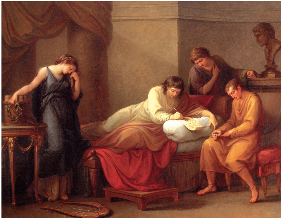
1.3. Vergilius schrijft op zijn doodsbed het opschrift voor zijn graf. Schilderij van Angelika Kauffmann uit 1785.