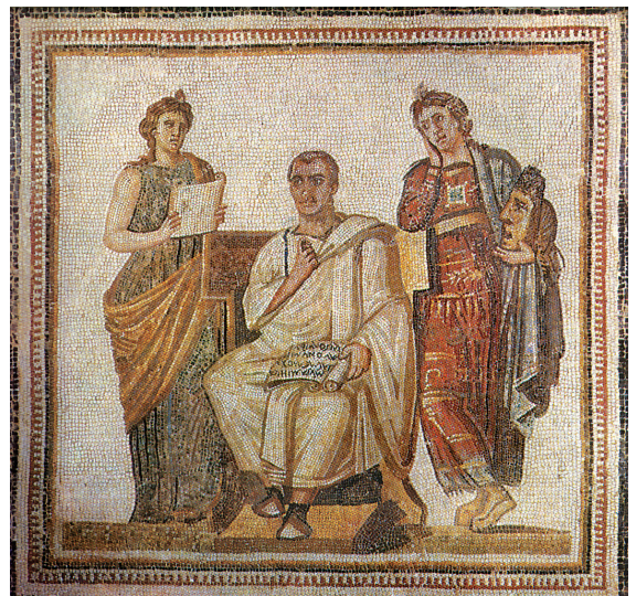
1.1. Vergilius met twee Muzen. Mozaïek uit Carthago (Tunis).

De laatste elf jaar van zijn leven werkte Vergilius aan de Aeneis , 'het lied van Aeneas', waarin hij de lotgevallen van de Trojaanse held Aeneas vertelt, die na de val van Troje na lange omzwervingen in het Italische Latium aankomt, vanwaaruit zijn nakomelingen Rome zullen stichten. In 19 v.Chr. vertrok Vergilius voor drie jaar naar Griekenland met de bedoeling om daar zijn Aeneis te voltooiën. Hij werd echter ziek en moest noodgedwongen naar Italië terugkeren. Kort na zijn aankomst overleed hij in Brindisi. De Aeneis was nog niet helemaal af (vandaar het voorkomen van halve regels). Op zijn sterfbed zou hij keizer Augustus verzocht hebben het gedicht niet te publiceren. Hij zou het manuscript zelfs hebben willen verbranden. Maar op de uitdrukkelijke wens van Augustus is het toch uitgegeven.