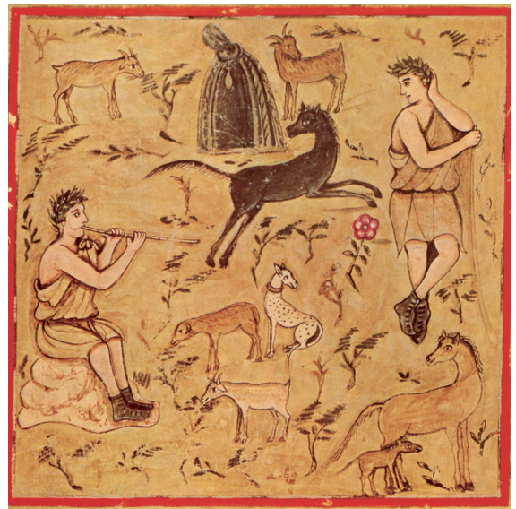
1.5. Twee herders met hun vee. Miniatuur bij het derde boek van Vergilius' Georgica in een 5de-eeuws handschrift.

Vergilius schreef de Georgica in de jaren 38-29. Het is een didactisch werk, een leerdicht, over het boerenbedrijf, waarin achtereenvolgens in vier boeken gesproken wordt over de akkerbouw, de bos- en wijnbouw, de veeteelt en de bijenteelt. Ook al behoort het werk tot het genre van het leerdicht, dat wil zeggen dat de dichter zijn gedicht gebruikt om informatie en nuttige kennis over te dragen, toch heeft Vergilius elke associatie met een technisch handboek willen vermijden: er zijn geen lange voorwoorden, samenvattingen of argumentaties en bewijsvoeringen. Het werk is dan ook niet bedoeld als een praktische leidraad voor de kleine boer. De dichter wil de lezer vooral esthetisch genot verschaffen. Toch gaat het gedicht wel in grote lijnen over de praktijk van de kleine boer. Het is in de ogen van de dichter mogelijk dat een boer die over voldoende kennis van de natuur beschikt en in staat is te werken,