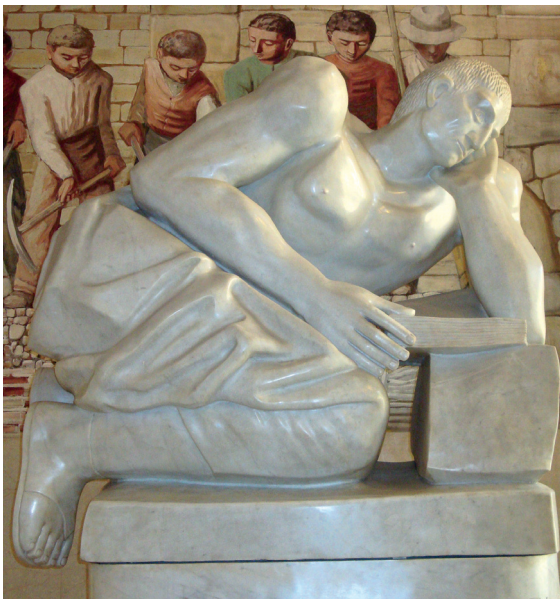
1.3. Standbeeld van Livius in 1942 gemaakt door de Italiaanse beeldhouwer Arturo Martini, opgesteld in de hal van de universiteit van zijn geboortestad Padua.

De Romeinse geschiedschrijvers hebben net als andere Romeinse wetenschappers en kunstenaars veel ontleend aan de Grieken. Zo staat de Romeinse geschiedschrijving duidelijk in de traditie van de Griekse historiografie. De Grieken zijn als het ware de uitvinders van een min of meer wetenschappelijke benadering van geschiedschrijving: deze wordt beschouwd als een vorm van onderzoek dat gebaseerd is op waarnemingen van de geschiedschrijver zelf en anderen. Hij moet zijn best doen om de feiten van zijn onderwerp te achterhalen. Onderzoek houdt dus meer in dan alleen een weergave van de feiten. Verder moet de historicus kritisch zijn ten aanzien van zijn bronnen. Hij neemt niet klakkeloos over wat hem wordt verteld of wat hij leest. Sommige dingen