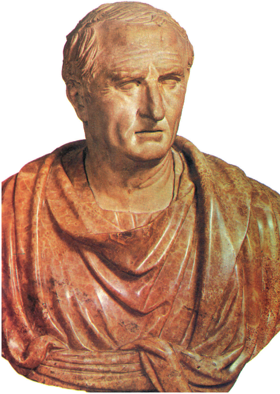
1.5. Portret van Cicero uit de 1ste eeuw n.Chr.

Maar terug naar mijn uitgangspunt; zien jullie, wat voor een belangrijke taak voor een redenaar de geschiedschrijving is, misschien wel het meest op het punt van harmonisch taalgebruik en bonte verscheidenheid van inhoud? Toch tref ik hier voor nergens afzonderlijke retorische voorschriften aan, omdat ze nu eenmaal voor de hand liggen. Iedereen kent het eerste gebod voor de geschiedschrijver: de moed hebben geen