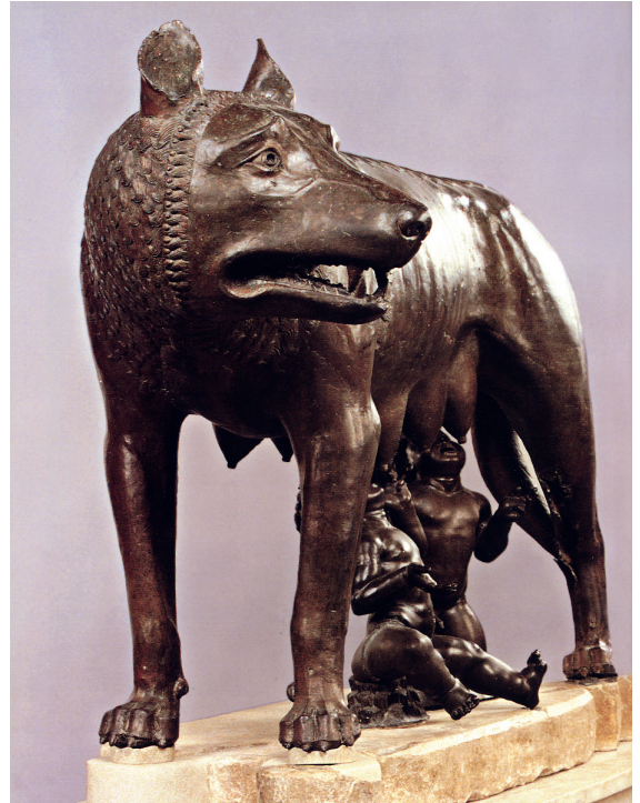
1.4. De wolvin voedt Romulus en Remus. Een beeld uit de Middeleeuwen naar een voorbeeld uit de 5de eeuw v.Chr. De jongetjes zijn pas in de 15de eeuw toegevoegd.

De gebeurtenissen worden ingedeeld en beschreven in een ordening per jaar, ook al strekten de gebeurtenissen zich in feite over een langere periode uit. Ook Livius heeft deze annalistische ordening systematisch toegepast (zie verder pag. 12).