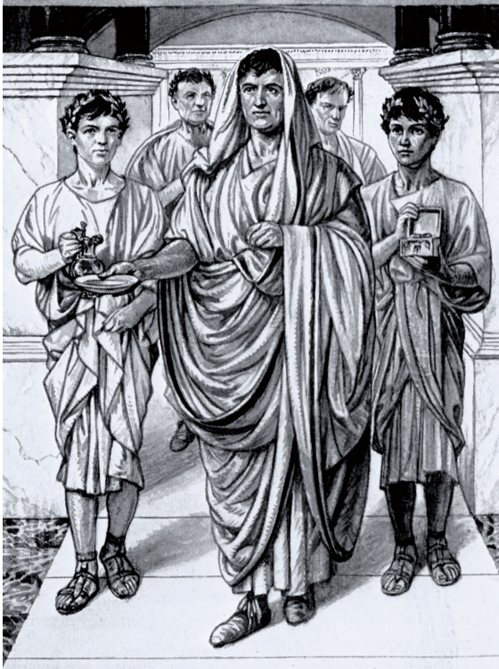
1.6. De Pontifex Maximus. Tekening van J.H. Isings.

kennis van konden nemen. Hierop noteerde hij de namen van de consuls en andere overheidspersonen, maar ook veldslagen, zons- en maansverduisteringen, wondertekens etc. Omstreeks 120 v.Chr. begon men met het publiceren van deze lijsten. Verder hielden belangrijke adellijke families archieven bij, waarin soms ambtelijke stukken en gedenkschriften, afkomstig van beroemde voorouders, werden bewaard. Bij begrafenissen van voorname familieleden werden indrukwekkende lijkreden gehouden, waarin de verdiensten van de overledenen werden geprezen. Ook deze werden soms bewaard in de familiearchieven. Livius, die hiervan gebruik heeft gemaakt, waarschuwt voor de betrouwbaarheid ervan: Ik denk dat de geschiedenis vervalst is door lofredes en foutieve onderschriften onder beelden: de diverse families eigenen zich de roem van heldendaden en ambten toe met onware berichten, die ons gemakkelijk op een dwaalspoor brengen. Zo zijn in elk geval de daden van enkelingen en de geregistreerde officiële gebeurtenissen door elkaar geraakt. (VIII, 40. 4-5).