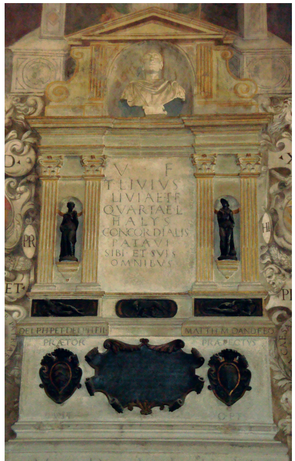
1.8. Grafmonument van Livius in 1547 opgericht in het Palazzo della Ragione in Padua.

Om een verhaal spannend te maken blik Livius soms als alwetende verteller vooruit op toekomstige gebeurtenissen ( prospectie ). Ook wijst hij geregeld terug naar zaken die al eerder zijn gebeurd ( retrospectie ).