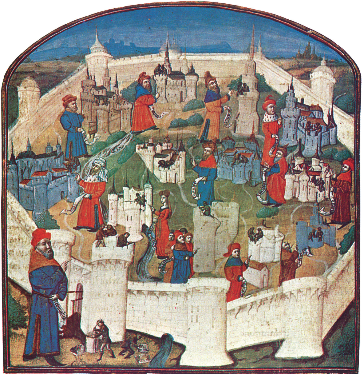
1.7. Stichting van Rome, illustratie in een 14de-eeuws handschrift.

fouten in het vertalen van zijn bron, maar in het algemeen is hij eerlijk in zijn behandeling van het materiaal.