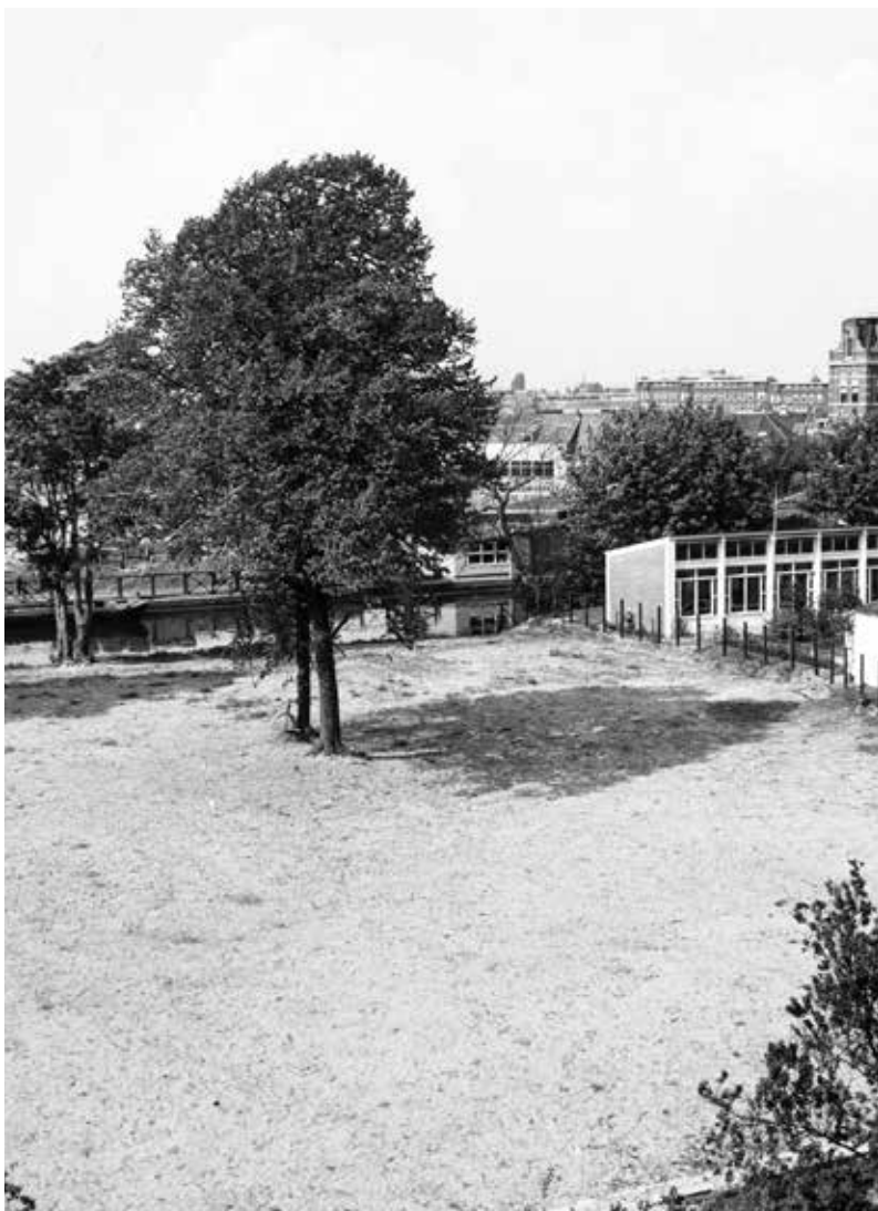
Kerkhof 'De Liefde' als zandlandje

die op 27 september 1893 werd ingewijd. Veel stof-felijke resten van De Liefde werden hier naartoe over-gebracht.