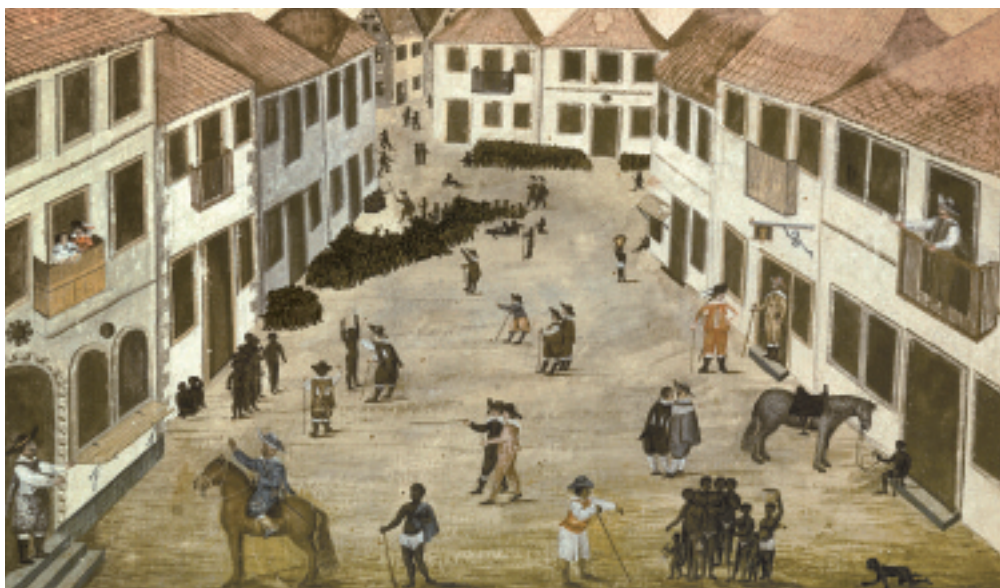
3 Zacharias Wagener, Slavenmarkt in Mauritsstad. Aquareel uit het Thierbuch.

steld, was nu verzekerd (afb. 1 en 2). Na aankomst werden ze op de markt gekeurd en verkocht (afb. 3). Suiker en andere producten werden vervolgens naar Holland verscheept en verhandeld. In de hofhuishouding van Johan Maurits zelf waren slaven aan het werk en nieuw onderzoek laat zien dat hij ook persoonlijk profiteerde van de slavenhandel. 2