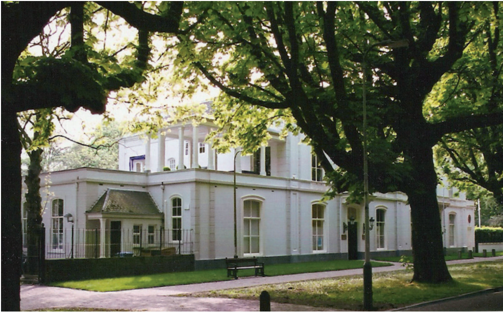
Het huis Sophialaan 9 in 2013. Foto Caroline de Westenholz

Bons souvenirs d'un vieux Père de John Ricus Coupe- rus, manuscript. Collectie Nationaal Archief. Foto Rob Mostert