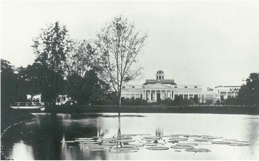
Paleis van de gouverneur- generaal van Nederlands- Indië te Buitenzorg (Bogor).