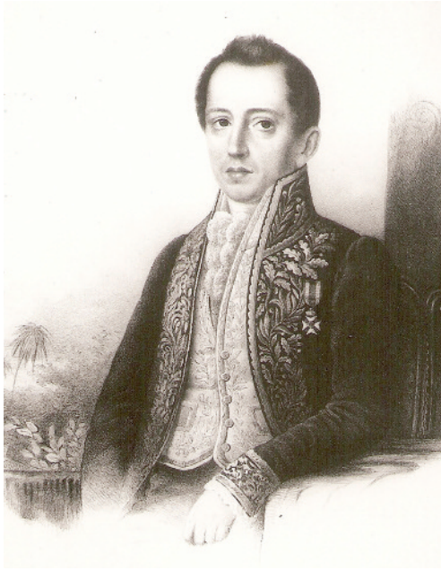
Joan Cornelis Reynst als waarnemend gouverneur-generaal van Nederlands-Indië. Vermoedelijk door J.C. Valois. Lithografie (1844).