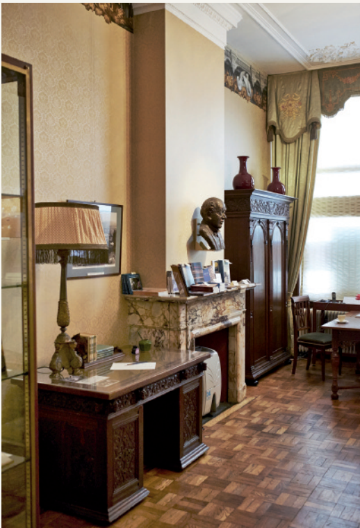
Het interieur van het Louis Couperus Museum in 2013 met het bureau van Couperus en de Utrechtse poortkast die de schrijver zijn leven lang begeleid hebben.

In 1991 publiceerde Frédéric Bastet De wereld van Louis Couperus , een visuele biografie over leven en werk van de grote Haagse schrijver. Het boek weerkaatste de auteur in alle fasen van zijn leven ‘alsof hij door een feestelijke spiegelgalerij flaneert’.