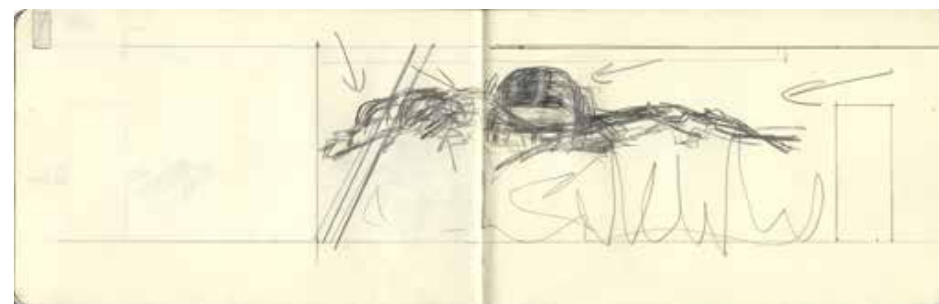
potloodschetsen voor de wandtekening in RC de Ruimte IJmuiden - zomer 2010