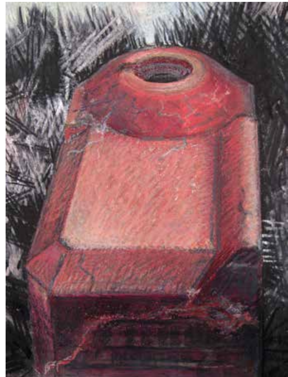
Tobruk West aan Zee Terschelling houtscool en pastel op aluminium 40x30 cm – 2011