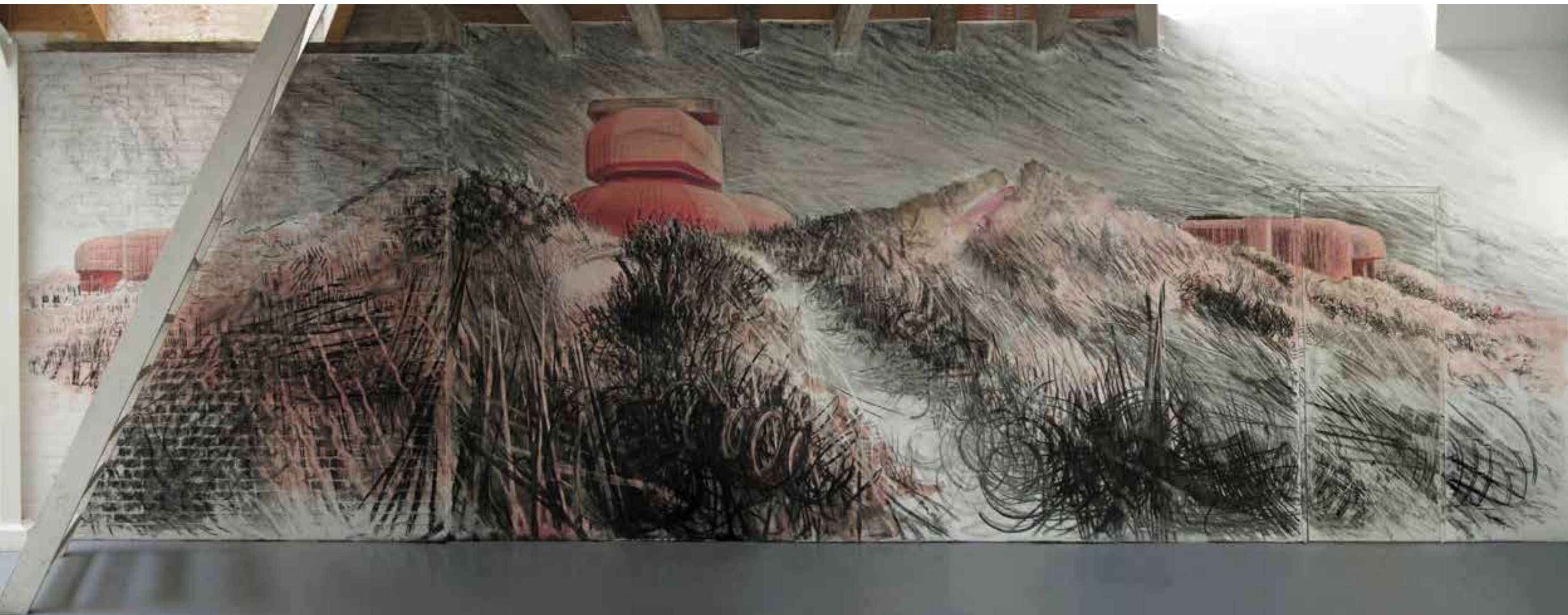
Sirenen IJmuiden – wandtekening in houtskool en pastel in RC de Ruimte IJmuiden 300×900 cm – 2010