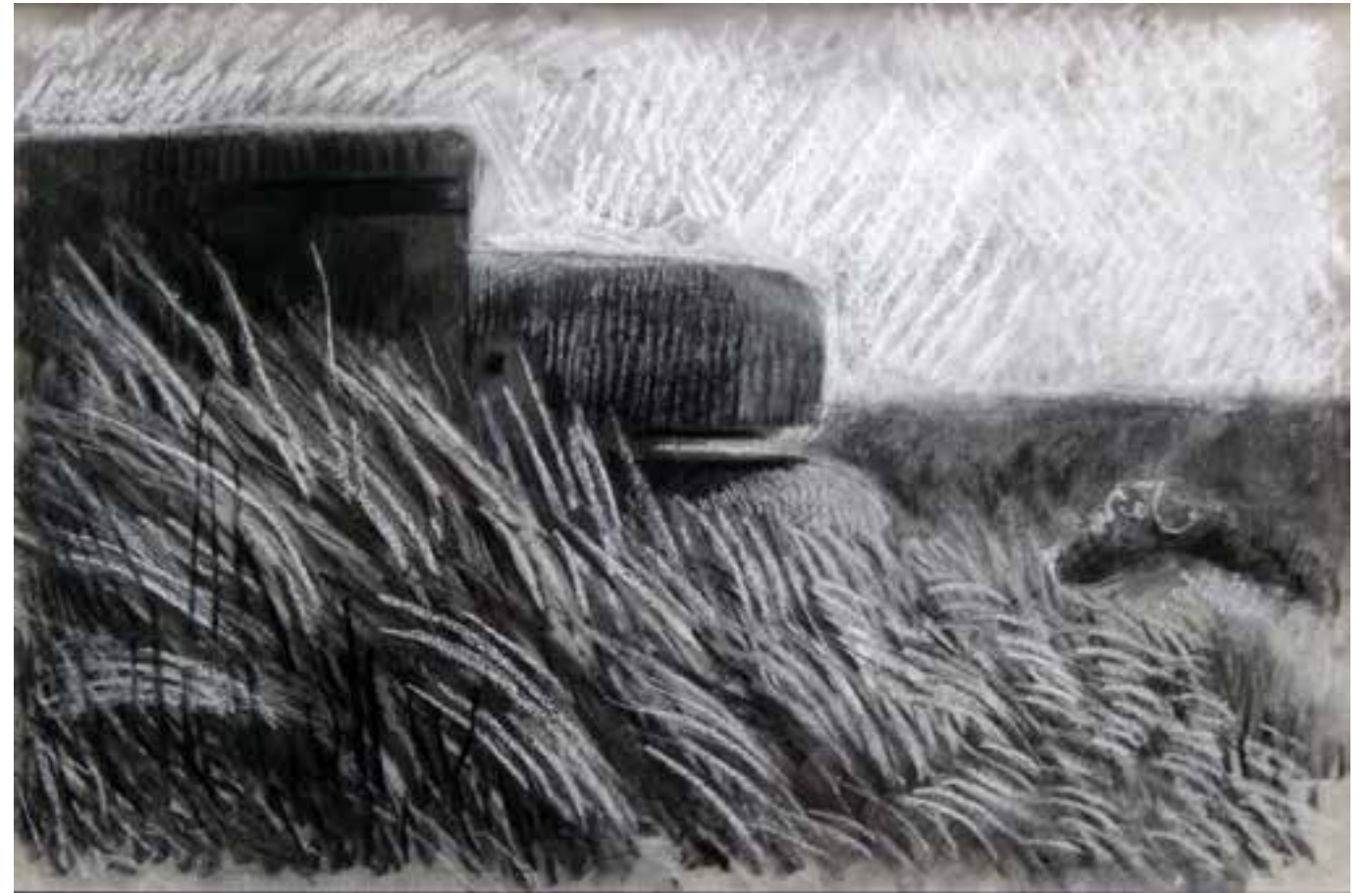
Bunker stelling IJmuiden houtschool en pastel op papier 31×47 cm – 2010