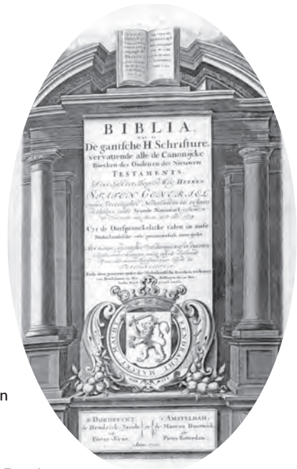
De titelpagina van de Statenvertaling

Sinds de jaren zeventig is het proces van ontkerkelijking versneld doorgegaan. Het aantal mensen dat in een persoonlijk God gelooft, is in deze tijd gehalveerd. Maar de harde ontkenning van het bestaan van God of een hogere macht is niet erg toegenomen (1966: 6 procent; 1996: 10 procent). Dat betekent dat het traditionele geloof vervaagt. De helft van de Nederlanders is het eens met de uitspraak: 'God is niet daarboven, maar alleen in de harten der mensen'. Er is in dit verband gesproken van een zekere horizontalisering van het geloofsleven (G. Dekker). We zien dit verschijnsel sterk terug bij jongeren, bij wie de buitenkerkelijkheid snel is gestegen, maar bij wie vooral in de jaren negentig de religieuze belangstelling is toegenomen. Vergeleken met 1991 geloofden in 1998 11 procent meer jongeren in een leven na de dood, 12 procent meer in het bestaan van hemel en hel, en 14 procent meer in religieuze wonderen. Was het in de Nederlandse samenleving vanouds zo dat godsdienst en kerk voor een belangrijk deel samenvielen, nu is bijna iedere Nederlander ervan overtuigd dat je een gelovig mens kunt zijn zonder ooit naar de kerk te gaan. In 1996 was nog slechts 4 procent het niet eens met bovengenoemde uitspraak, tegen 10 procent in 1966.