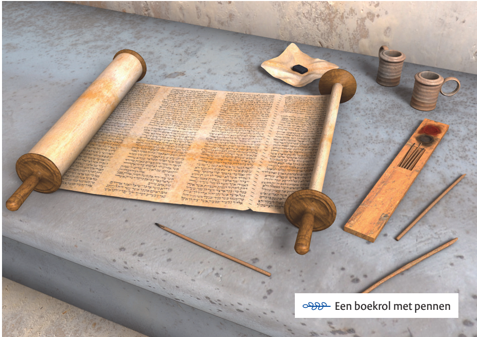
Een boekrol met pennen

In 1 en 2 Samuel staan de verhalen over de profeet Samuel, over Saul, de eerste koning van Israël, en over David, de belangrijkste koning van dit volk. In 1 en 2 Koningen gaat het over koning Salomo, en over de tijd dat het land Israël uit twee delen bestond: het koninkrijk Israël in het noorden en het koninkrijk Juda in het zuiden. Het koninkrijk Israël wordt veroverd door de koning van Assyrië en het koninkrijk Juda door de koning van Babylonië.