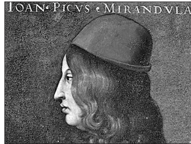
Pico della Mirandola, auteur van Over de waardigheid van de mens .

hij aangeeft dat het de mens zelf is die zijn levenslot bepaalt en vormt. Daarnaast probeert hij ideeën uit diverse godsdiensten, uit het heidendom en het hellenisme, met elkaar te verzoenen om te komen tot een soort universele kennis en om de werkelijke waardigheid van de mens gestalte te geven. Hij demonstreerde hiermee een grote mate van openheid en verdraagzaamheid ten aanzien van andersdenkenden. En hij greep terug naar de teksten van Plato en Aristoteles en andere grote namen van de oudheid, onder wie ook heel wat wiskundigen. Hij vond het spijtig dat hun geschriften dreigden te verdwijnen in de nevelen van de geschiedenis. "Vandaag de dag is zij [de geschriften van de oudheid], evenals andere mooie en goede dingen, door nalatigheid van de latere levenden zo in vergetelheid geraakt, dat er nauwelijks nog sporen van terug te vinden zijn." Je proeft in die woorden zijn spijt en zijn verlangen dit gedachtegoed opnieuw de plaats te geven dat het verdient. 23