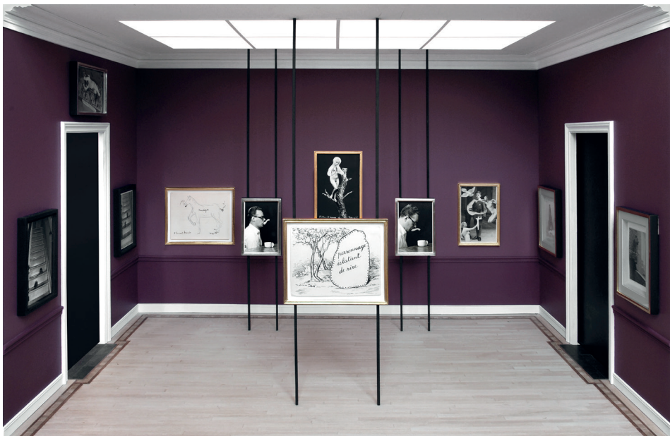
Museum-op-schaal-box – SURREALISM

Met mijn inmiddels nieuw samengesteld gezin van vier en gesteund door mijn partner, werd in ons huis een verdieping ingericht als tentoonstellingsruimte. Dit was een keuze op basis van mijn eigen