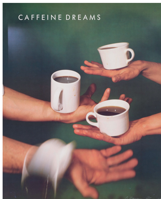
Caffeine Dreams – BRUCE NAUMAN, 1987

Het bijzondere aan een Wunderwall is dat hij mee evolueert met je persoonlijkheid, met je gezinsleven, met de samenleving waarvan je deel uitmaakt. Een Wunderwall met verschillende kleine, grotere