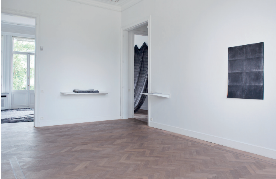
In de galerie G262 in de Lange Leemstraat. The lasting one, that didn't last, that still lasts