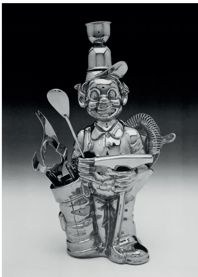
Luxury and Degradation – JEFF KOONS, 1986