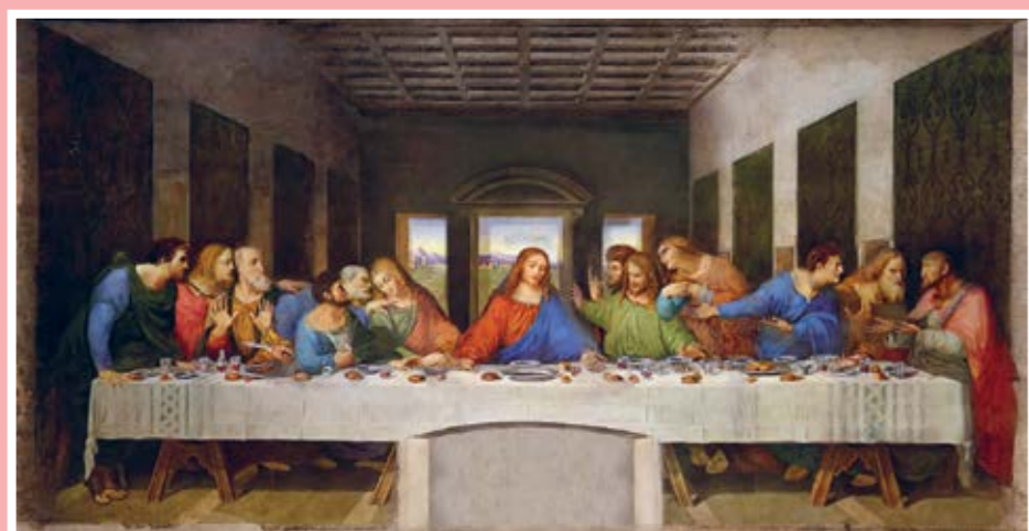
LEONARDO DA VINCI, HET LAATSTE AVONDMAAL, 1495 EETZAAL VAN HET KLOOSTER VAN SANTA MARIA DELLE GRAZIE, MILAAN

Heel erg lang geleden vroeg iemand aan Leonardo da Vinci om het Laatste Avondmaal OP DE MUUR van de eetzaal van een klooster te schilderen als geschenk voor de PATERTJES die daar woonden. Leonardo deed het graag en schilderde het allerlaatste avondeten dat Jezus at met zijn vrienden op de stenen muur. Normaal gezien schilderde Leonardo zijn muurschilderingen OP EEN LANGE WITTE KALK .