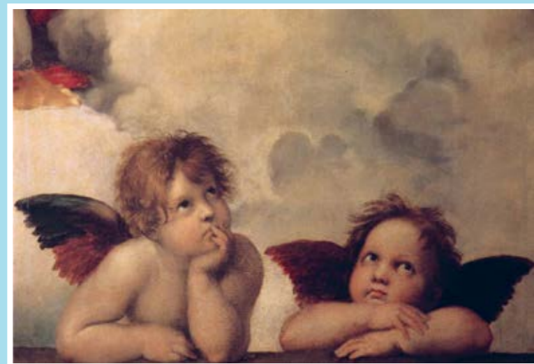
RAFAËL, DE ENGELTJES VAN DE SIXTIJNSE MADONNA, 1512 GEMALDEGALERIE ALTE MEISTER, DRESDEN

De kans is groot dat je deze twee sloebers ooit al eens zag. Ze zijn wereldberoemd. Maar weinig mensen weten dat die twee schattige engeltjes een RANDVERSIERING zijn van een groot schilderij van Rafaël.