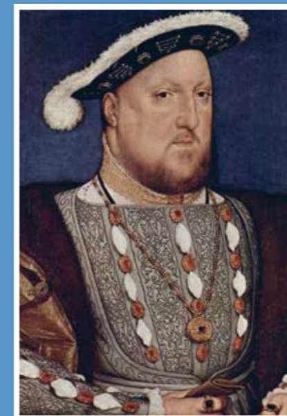
HANS HOLBEIN, PORTRET VAN HENDRIK 8, 1537 WALKER ART GALLERY, LIVERPOOL

Dit schilderij werd gemaakt door de Duitse kunstenaar Hans Holbein. Het is een portret van HENDRIK 8, DE KONING VAN ENGELAND . Hans schilderde die koning tientallen keren. Hij was namelijk helemaal uit Duitsland naar Engeland verhuisd om er de HOFSCHILDER en MODEONTWERPER van koning Hendrik 8 te worden. Omdat Twitter en facebook in die tijd nog lang niet waren uitgevonden, werd elke foto met de hand op EEN HOUTEN PLANKJE geschilderd en met ruiters te paard de wereld in gestuurd. Koning Hendrik wilde namelijk dat iedereen in het koninkrijk zijn gezicht zou kennen en aanbidden. Daarom liet hij Hans Holbein heel vaak portretjes schilderen waarop de koning altijd een beetje KNAPPER WERD AFGEBEELD dan in het echt (want Hendrik was geen schoonheid en hij woog maar liefst 178 kilogram). Een beetje fotoshoppen dus.