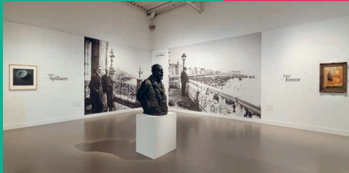
Mu.ZEE – Musée d'art sur mer / Mu.ZEE – Kunstmuseum aan Zee