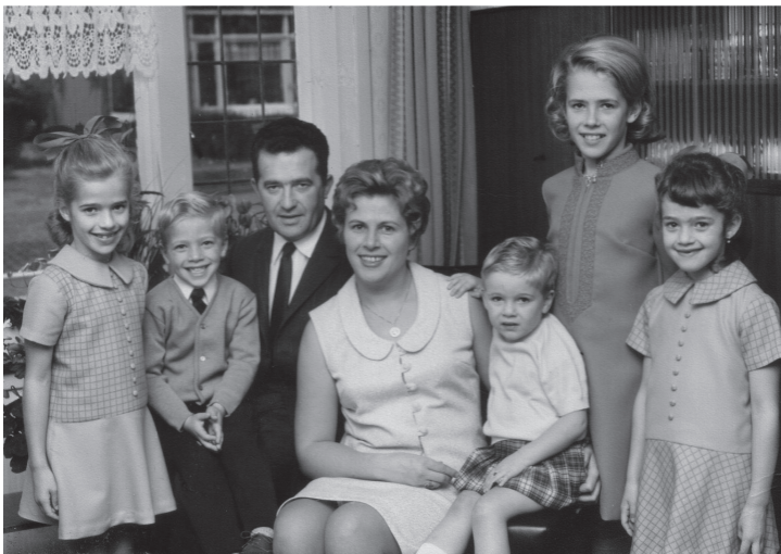
Samen met de ouders.